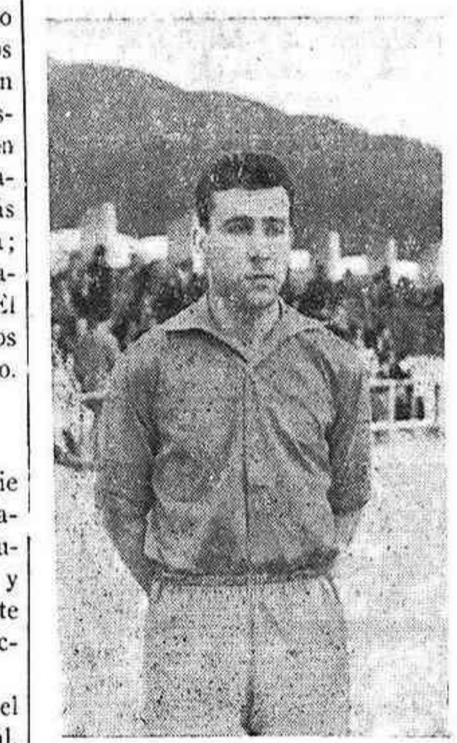
Baz, que junto a Barón y Lloret, tuvo una buena actuación en el bloque defensivo.