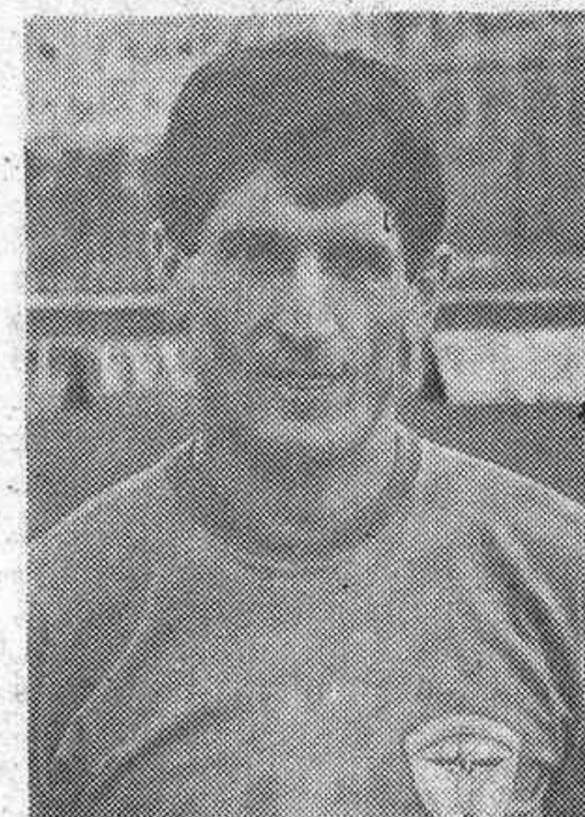
AYUCAR: Una efectividad goleadora permanente.

Para mercancía ¿Les interesa? Llámenos. Transportes SANTOS Teléfono 22 34 98