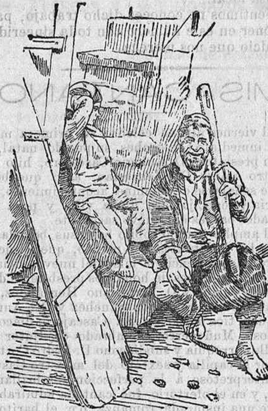
Pescador de Mesina

dado huella, pues el mar ha modificado bastante la línea de la costa, especialmente en el estrecho de Mesina, punto central del movimiento sísmico.