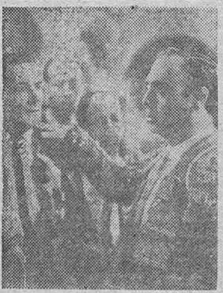
Una escena de "Currito de la Cruz", la excepcional película taurofónica de Cifesa, que tan magistralmente ha realizado Luis Lucía, y que triunfa en las pantallas de España. Próximamente se estrenará en Madrid en un lujoso cinema