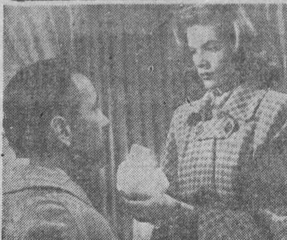
Laureen Bacall y Humphrey Bogart, protagonistas de la película Warner Bros. "La senda tenebrosa", que se estrena hoy en el lujoso cine Avenida, y que constituirá un gran acontecimiento cinematográfico