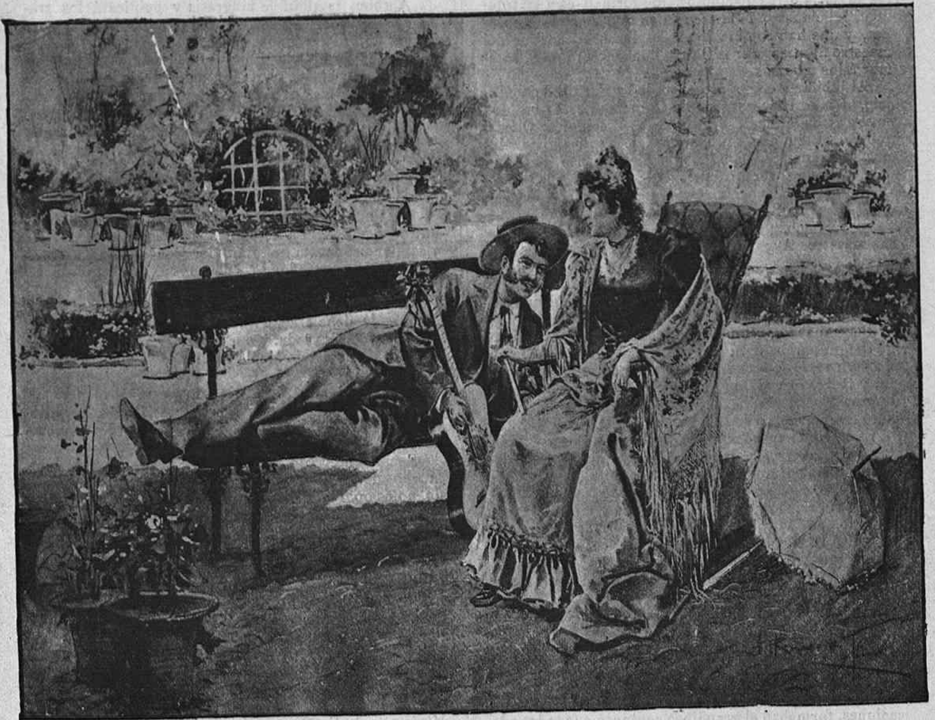
CUADRO DE JULIO ROMERO DE TORRES