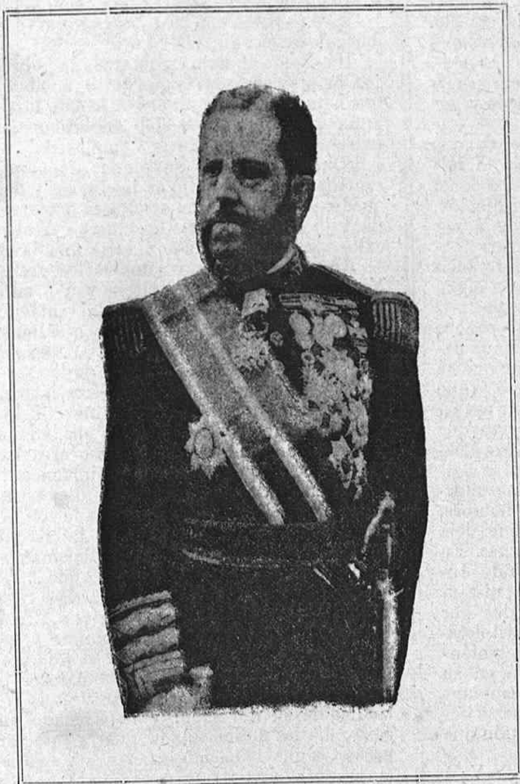
EL GENERAL WEYLER