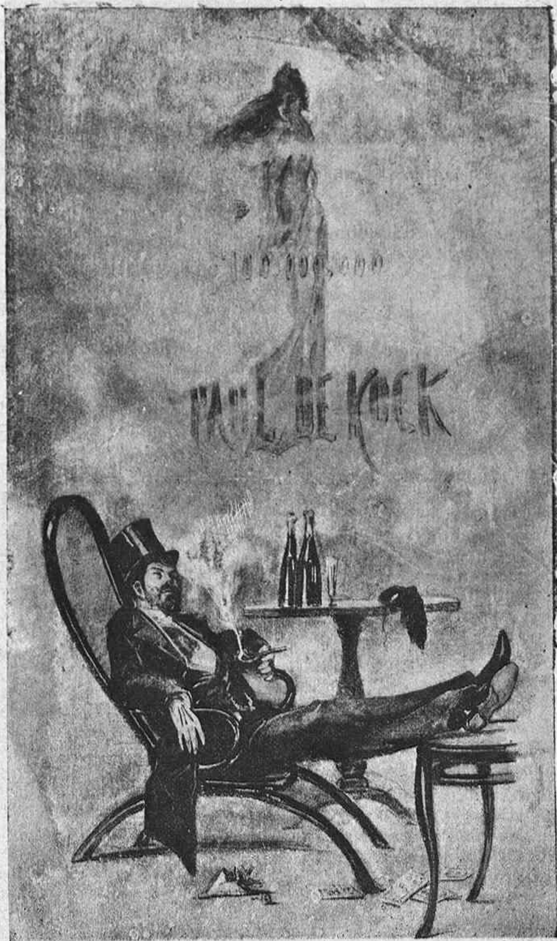
DESPUES DEL BAILE.—Composición y dibujo de J. Romero de Torres.