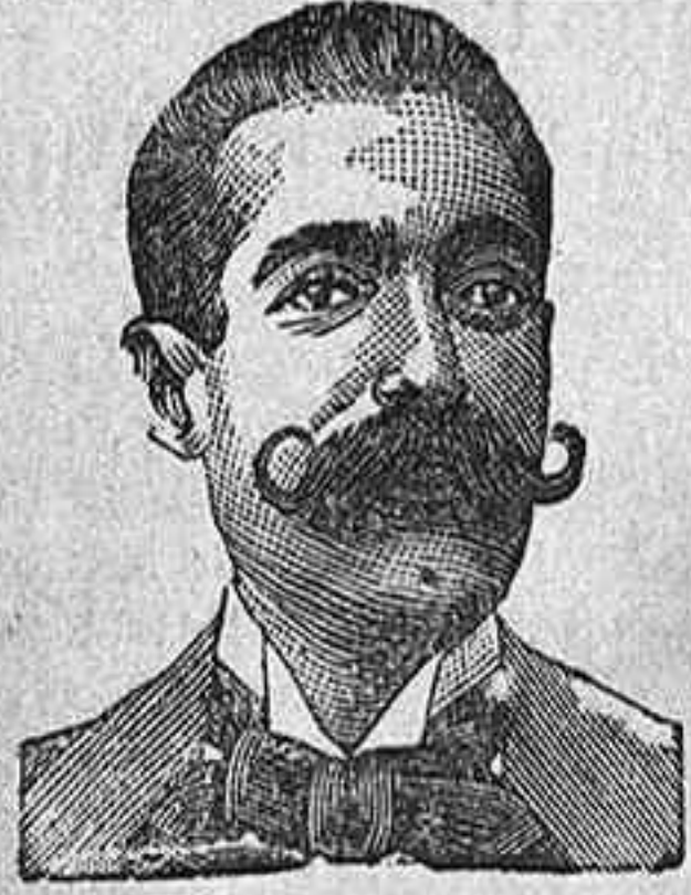
A. SALVATI COSTANZI CALLE DIPUTACION 435 BARCELONA