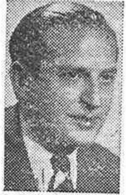
J. Calvo Sotelo

Contraviniendo el refrán deseo que los que esperan no desesperen.