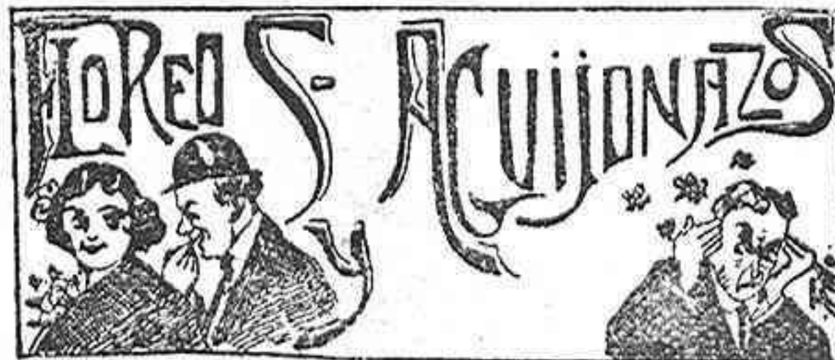
- Cabos sueltos -