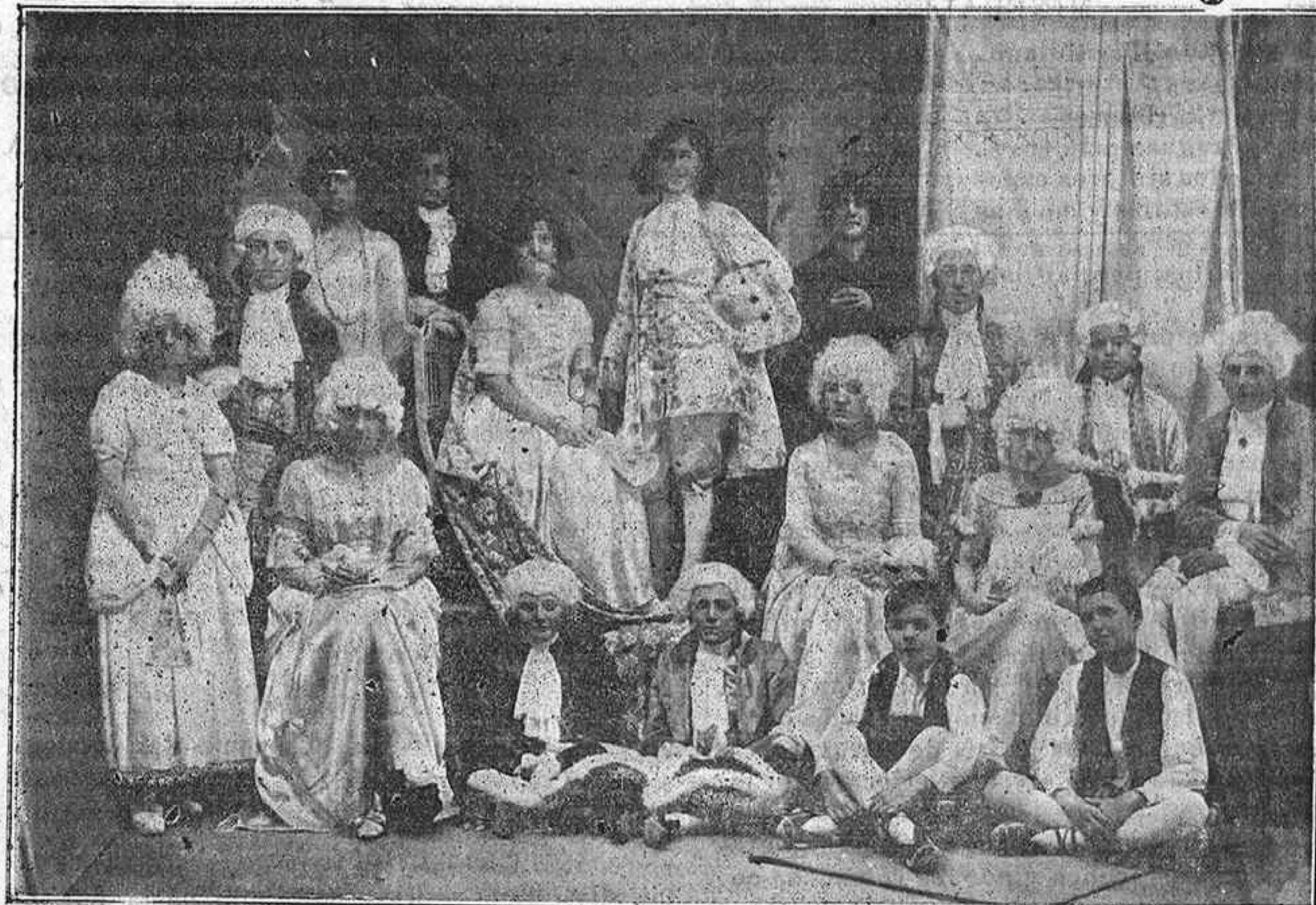
Principales intérpretes de la preciosa comedia LA GENICIENTA, original del insigne Benavente, representada en el Teatro-Casino, a beneficio de los niños pobres de la Doctrina Cristiana.

En la ponencia discutida por la Diputación de Madrid, se reduce el número de diputados elegidos por sufragio universal a uno por cada partido judicial, formando la tercera parte de la Corporación, y refor-