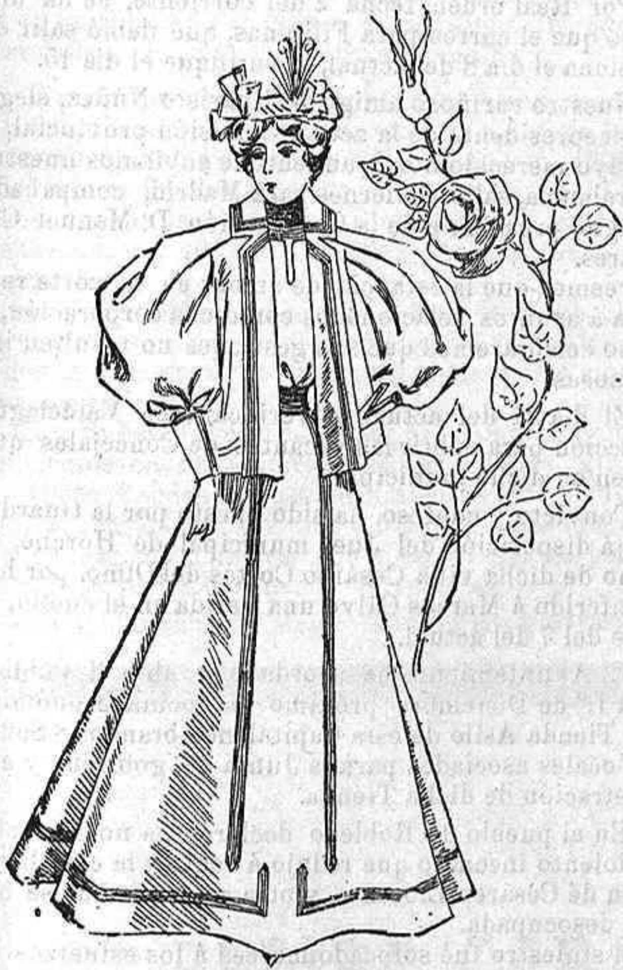
Traje de paseo.

Modelos exclusivos para nuestras lectoras, de los Grandes Almacenes de EL SIGLO, Barcelona (1).