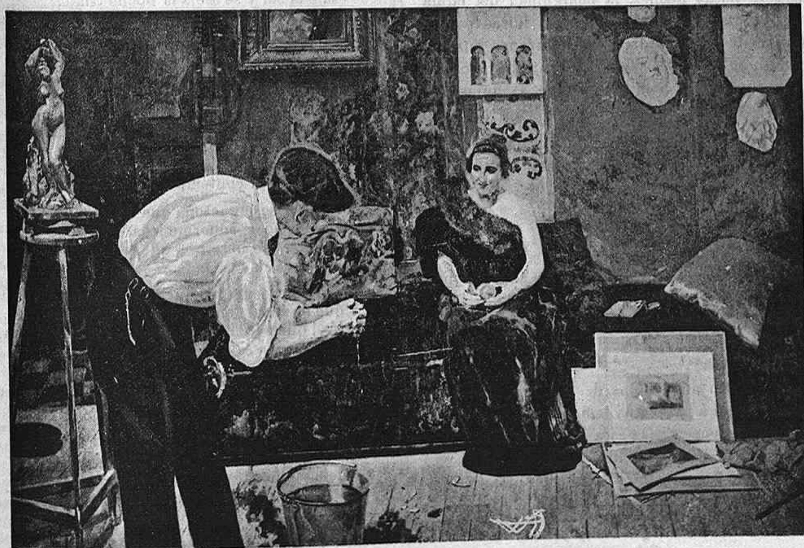
(Cuadro de D. Eduardo García Fernández).