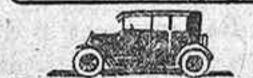
Sedan 4 puertas - 7880 Ptas