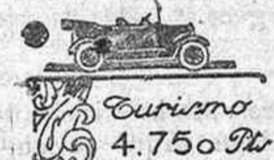
Turismo 4.750 Ptas