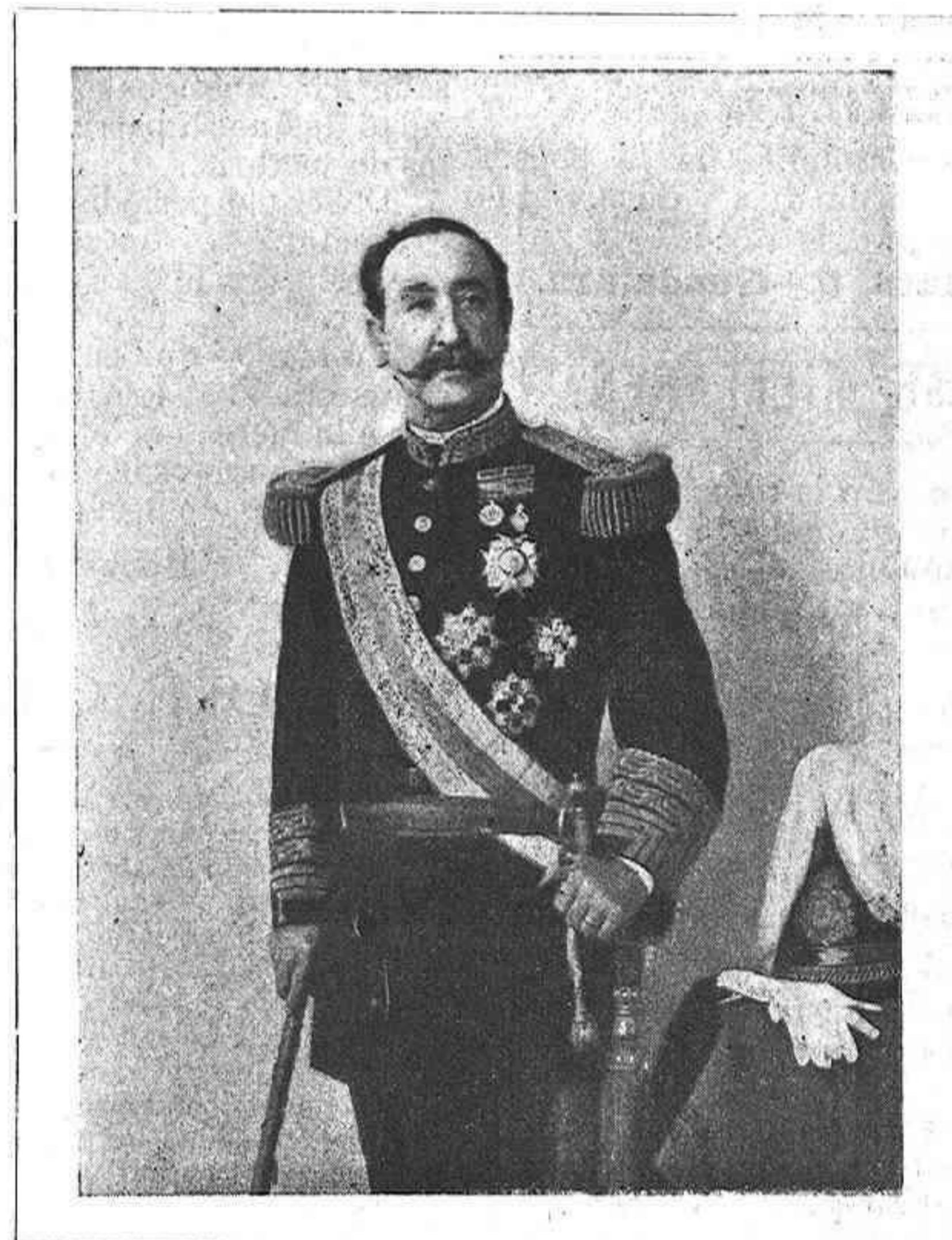
EXCELENTÍSIMO SEÑOR DON MANUEL MACÍAS

Actual Gobernador general de Puerto Rico.