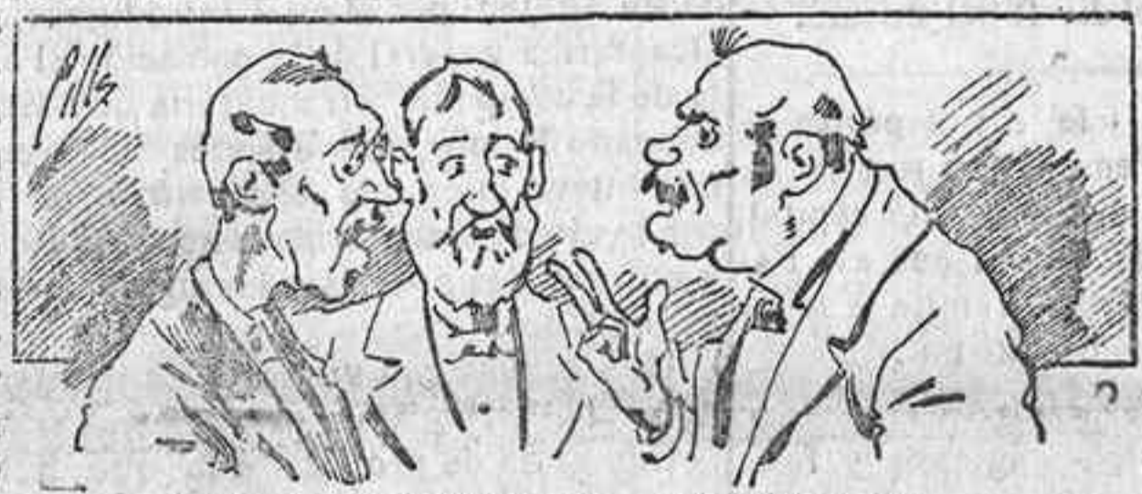
Abominan á nuestros libros..... pero los compran.

Todas las personas de gusto, curiosas é ilustradas deben pedir al Director de LA AVISPA, apartado núm. 8, MADRID, un ejemplar que se remite gratis y franqueado. Esta Revista Enciclopédica Popular publica recreaciones científicas, recetas de cocina, repostería, confitería, vinos, licores, pinturas, barnices, betunes y fórmulas para toda clase de industria, y cuantas noticias y conocimientos puedan ser beneficiosos. Cuenta además con buenos grabados, parte literaria excelente; da regalos mensuales á sus lectores con la Lotería Nacional y participaciones en la misma, á cuyo efecto compra todos los sorteos, y en una de las Administraciones más afortunadas por la suerte, billetes enteros. La suscripción y los números que se nos pidan se sirven gratuitamente á correo vuelto y franqueados, con sólo indicar el nombre y dirección del que lo desea en sobre dirigido al Sr. Administrador de