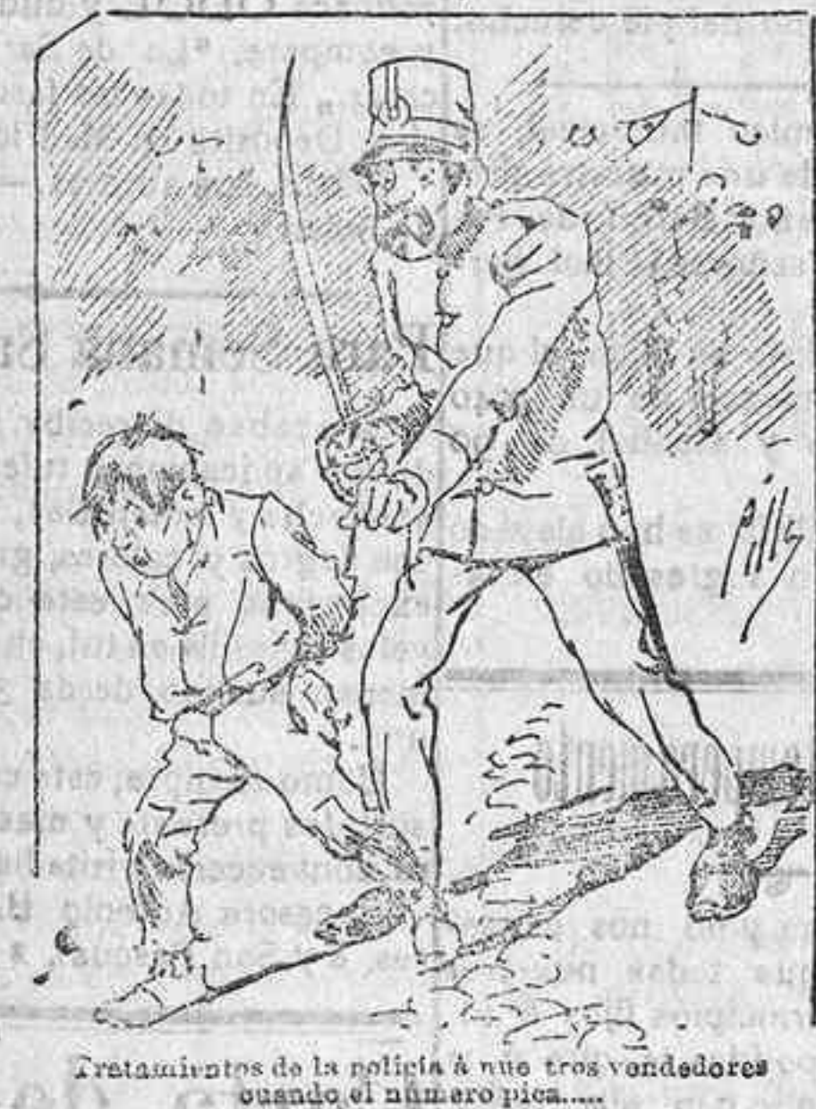
Tratamiento de la policía á uno tres vendedores cuando el número pica...

También puede pedirse LA AVISPA y el CATALOGO RESERVADO en casa de nuestros corresponsales autorizados, si no se quiere escribir á la Administración.