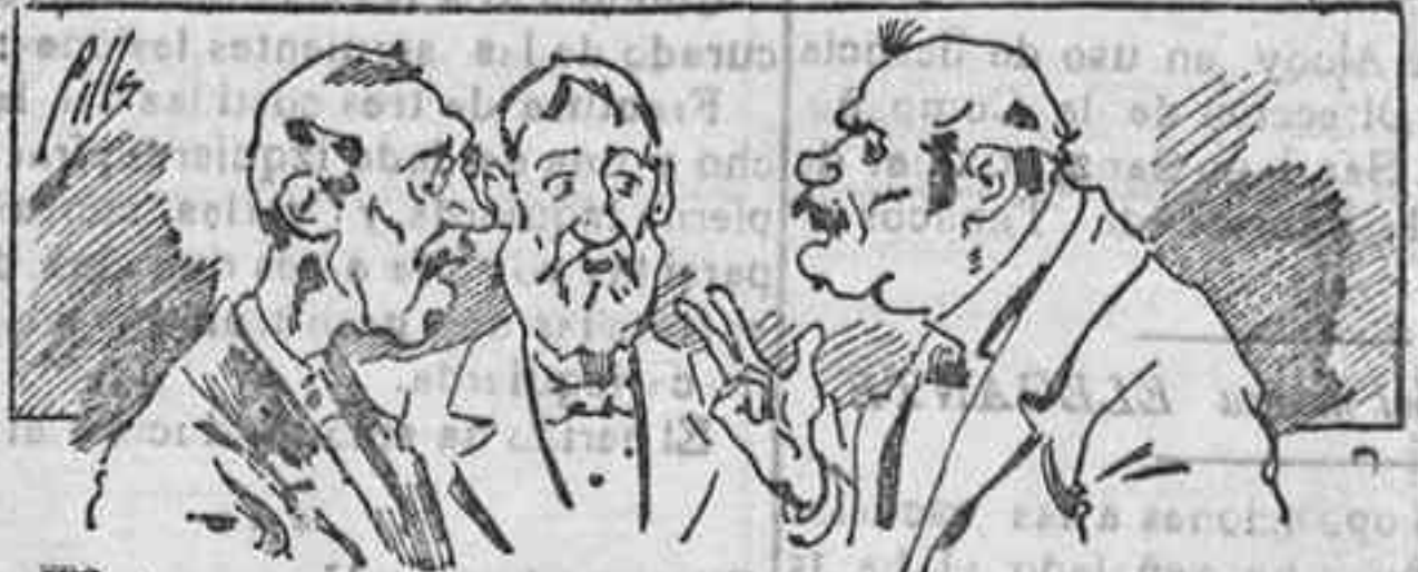
Atómicos é nuestros libros.... pero los compran.

Todas las personas de gusto, curiosas é ilustradas deben pedir al Director de LA AVISPA, apartado núm. 8, MADRID, un ejemplar que se remite gratis y franqueado. Esta Revista Enciclopédica Popular publica recreaciones científicas, recetas de cocina, repostería, confitería, vinos, licores, pinturas, barnices, betunes y cuantas noticias y conocimientos puedan ser beneficiosos. Cuenta además con buenos grabados, parte literaria excelente, da regalos mensuales á sus lectores con la Lotería Nacional y participaciones en la misma, á cuyo efecto compra todos los sorteos, y en una de las Administraciones más afortunadas por la suerte, billetes enteros. La suscripción y los números que se hospidan se sirven gratuitamente á correo vuelto y franqueados, con sólo indicar el nombre y dirección de' que lo desea en sobre dirigido al Sr. Administrador de