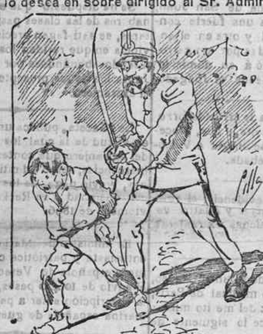
Tratamientos de la policía á nuestros vendedores cuando el número pica....