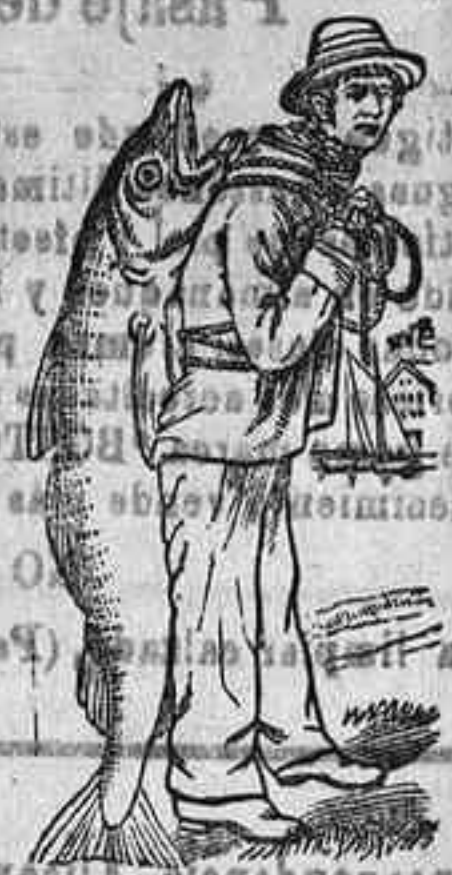
Islas de Lofoden (Noruega) 1903.

Desde muchos años yo pesco para ustedes el mejor bacalao que nada en estos mares, y este bacalao de Lofoden es el mejor del mundo. De estos bacalaoes yo peso con anzuelos y larva currián, yo reservo para Vds. exclusivamente los de primera calidad. En todos los años que trabajo para Vds. nunca les he dado un pescado de calidad inferior. Esta es la razón de la extraordinaria calidad crústica del aceite que yo extrajo para Vds. de los ligados de esos pescados siempre ha sido de primera calidad de la producción noruega, que es la más superior é inmejorable. Si el buen pueblo escocés quiere cosas de primera y de inferior calidad, pedirá siempre la Emulsion Scott, que lleva en el envoltorio la etiqueta que representa un gran barbero de Lofoden á costas de su S. S.