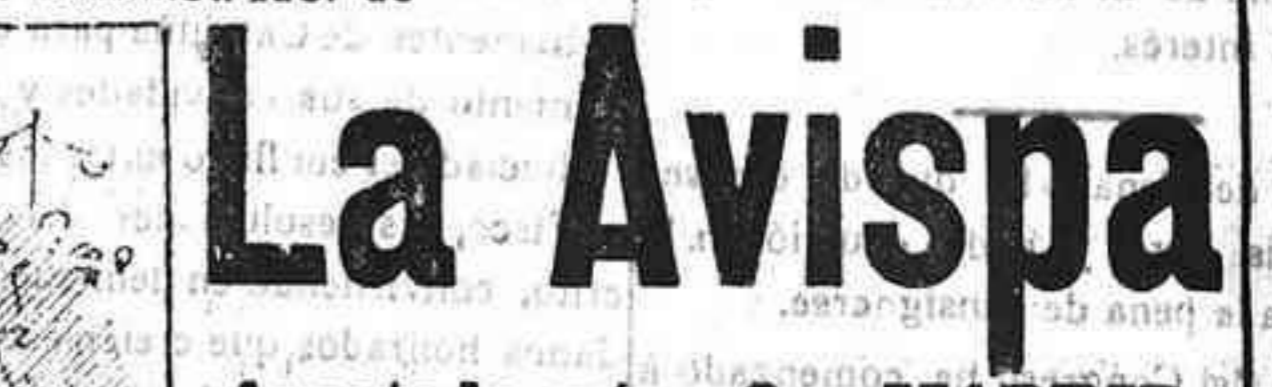
Abominan á nuestros libros... pero los compran.

Todas las personas de gusto, curiosas ó ilustradas deben pedir al Director de LA AVISPA, apartado núm. 8, MADRID, un ejemplar que se remite gratis y franqueado. Esta Revista Enciclopédica Popular, publica recreaciones científicas, recetas de cocina, repostería, confitería, vinos, licores, pinturas, barnices, betunes y fórmulas para toda clase de industria, y cuantas noticias y conocimientos puedan ser beneficiosos. Cuenta además con buenos grabados, parte literaria excelente; da regalos mensuales á sus lectores con la Lotería Nacional y participaciones en la misma, á cuyo efecto compra todos los sorteos, y en una de las Administraciones más afortunadas por la suerte, billetes enteros. La suscripción y los números que se nos pidan se sirven gratuitamente á correo vusito y franqueados, con sólo indicar el nombre y dirección de que se desea en sobre dirigido al Sr. Administrador de