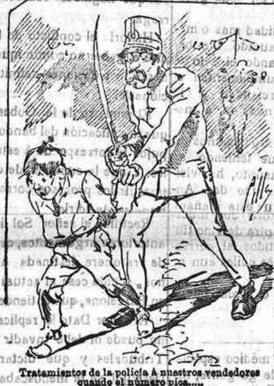
Tratamientos de la polifía á nuestros vendedores cuando el número piero...