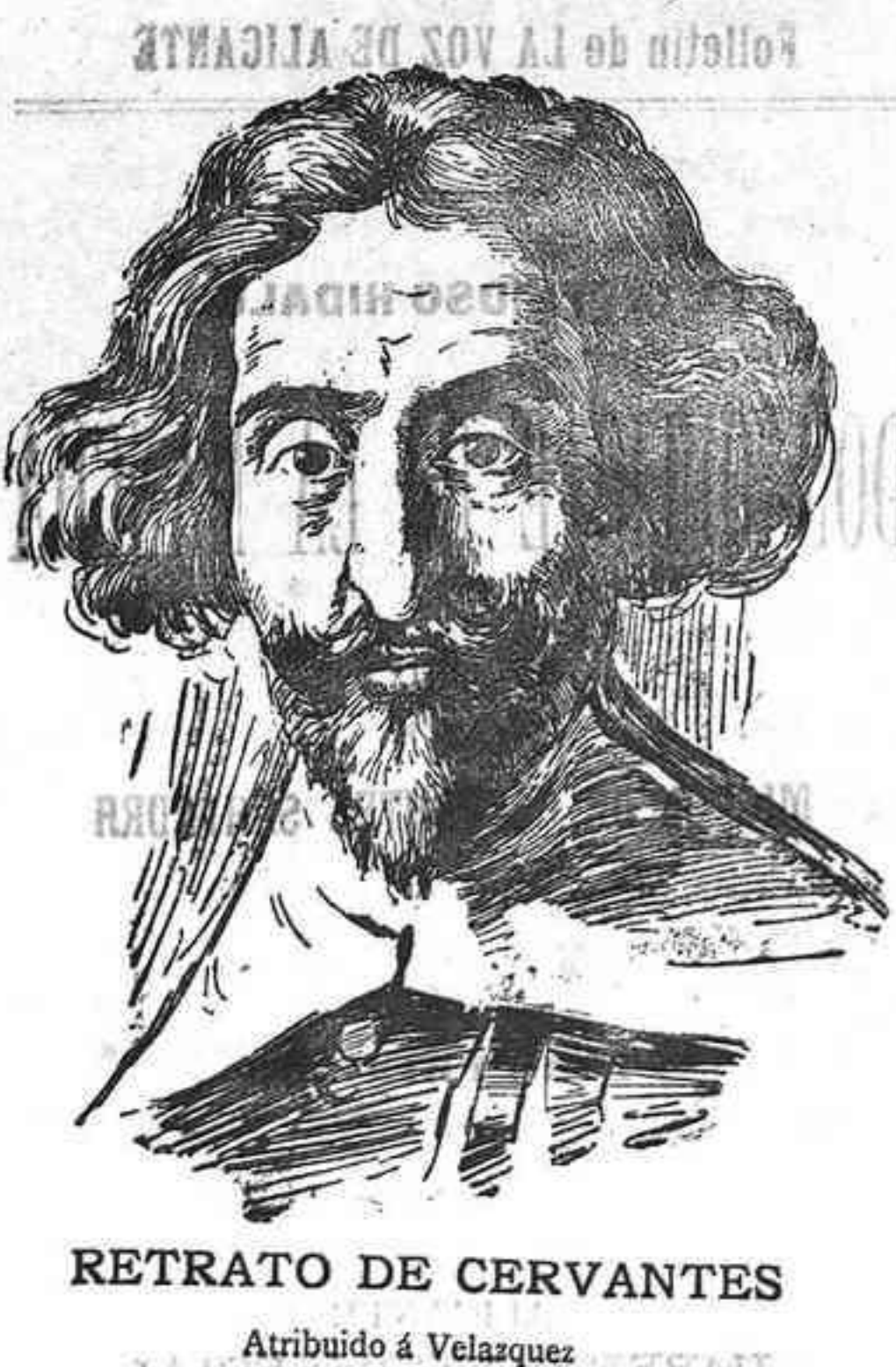
RETRATO DE CERVANTES

Los precios en los alcoholes siguen sosteniéndose con firmeza, siendo activa la demanda, pero sin llegar á pagar el comercio los precios que solicitan los fabricantes.