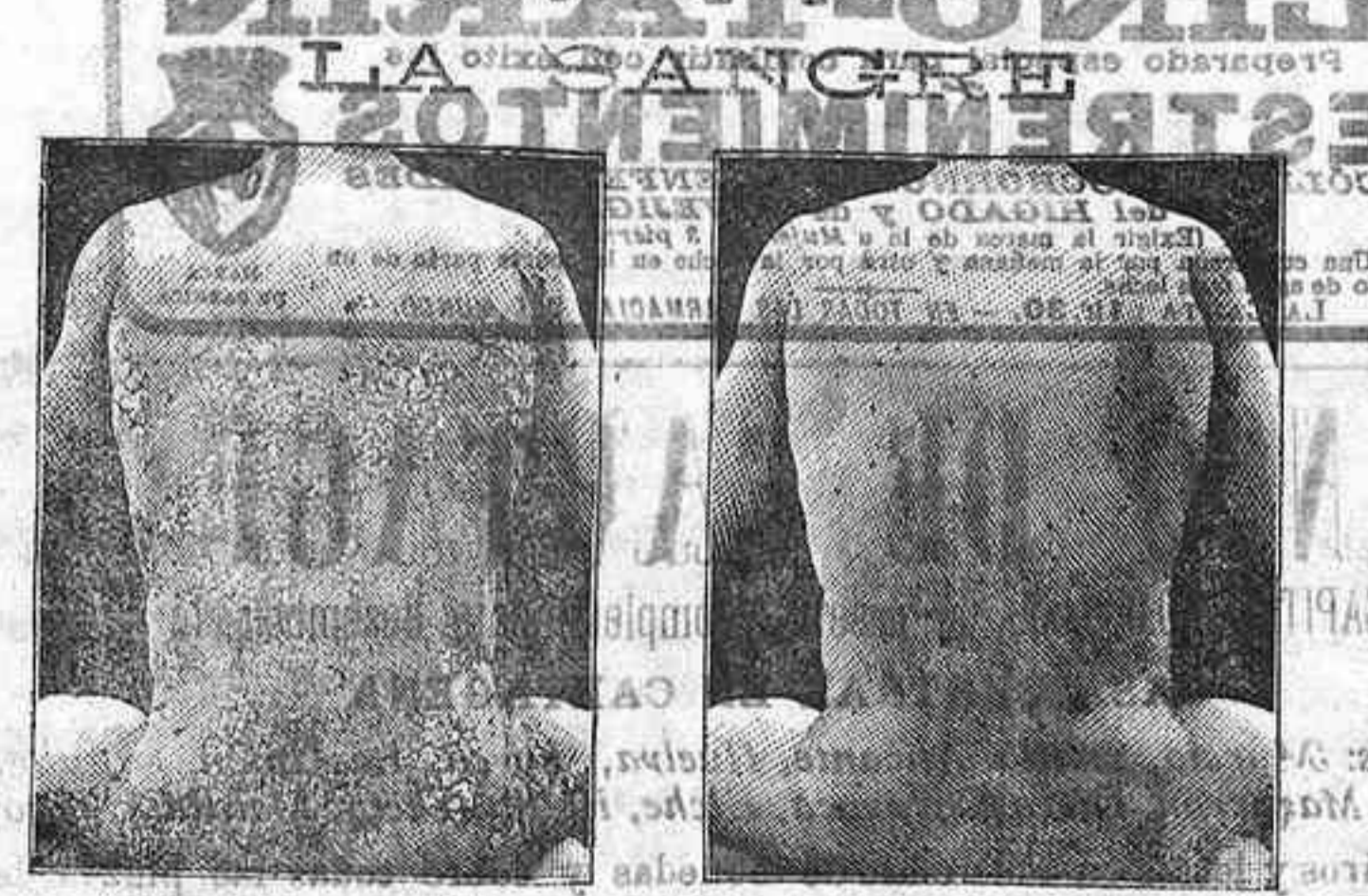
Antes de la curación y Después de 15 días de tratamiento

Curación de las enfermedades de la piel y también de las llagas de las piernas