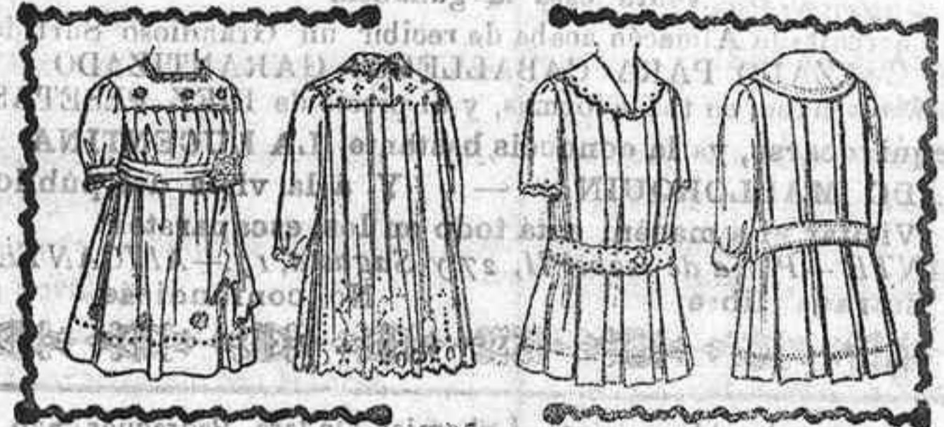
LA MODA EN LONGCHAMP.—LOS SOMBREROS.—EL BOLERO TRIUNFA

Las reuniones del hipódromo de Longchamp, son ya brillantes y animadas.