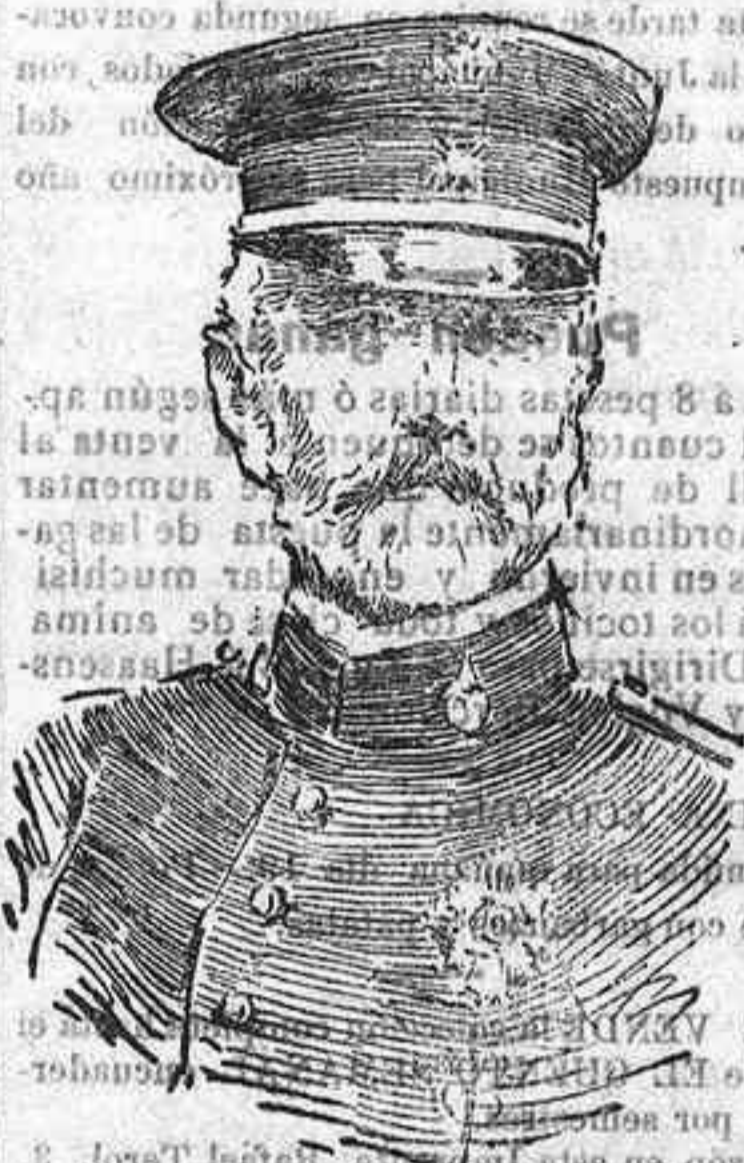
EL GENERAL DÍAZ ORDÓÑEZ

muerto en Melilla a consecuencia de las heridas que recibió en el combate del día 14.