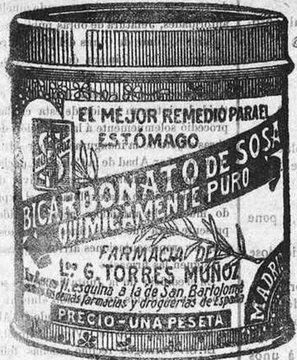
LATAS ECONÓMICAS A 5 PESETAS