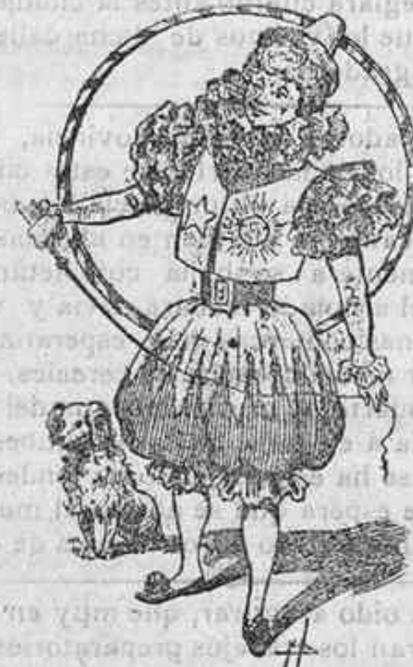
Disfrás de clown

trado de raso verde; lazadas del mismo color y arosas.