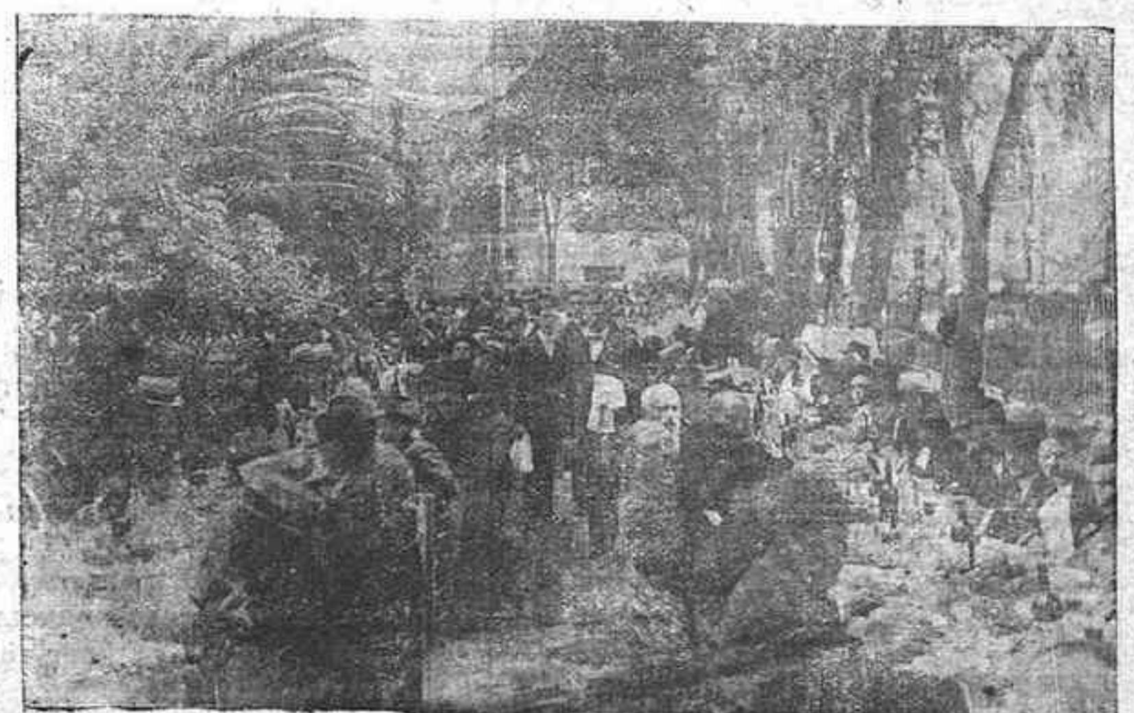
Vista parcial del banquete