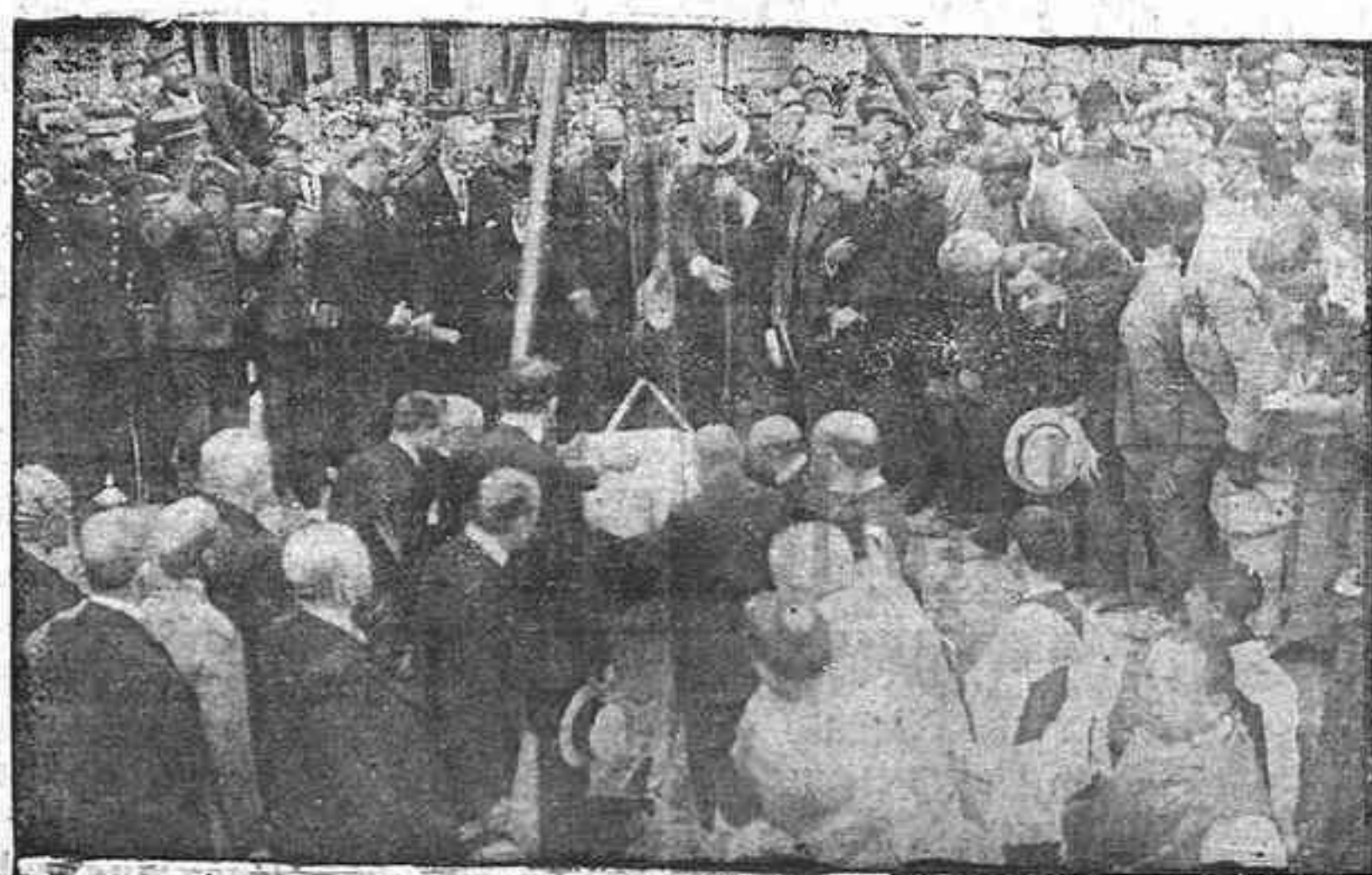
Colocación de la primera piedra de la Casa de Correos