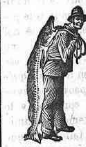
¡Obténase siempre la Emulsión con esta marca «El Pescador» marca del procedimiento Scott!

¡Ninguna otra emulsión, más que la de SCOTT, podía haber salvado a este niño, porque ninguna otra emulsión se compone de los mismos materiales puros y energicos, ni gustan tanto al paladar del niño, ni se digieren con la misma facilidad por el estómago del niño. ¡Le conviene usar la emulsión que está probado que cura—la de SCOTT con el Pescador y el Pescado en cada paquete. ¡La de Scott no es un experimento. Es la certeza. Ninguna otra emulsión disfruta tan altas recomendaciones como la de SCOTT. ¡En todas las droguerías y farmacias.