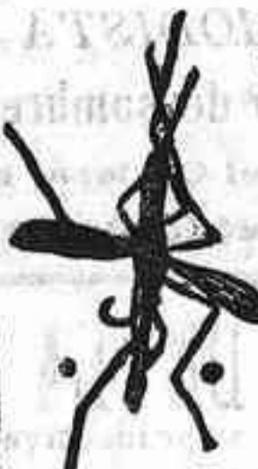
ANOFELE Mosquito que propaga la fiebre palúdica.