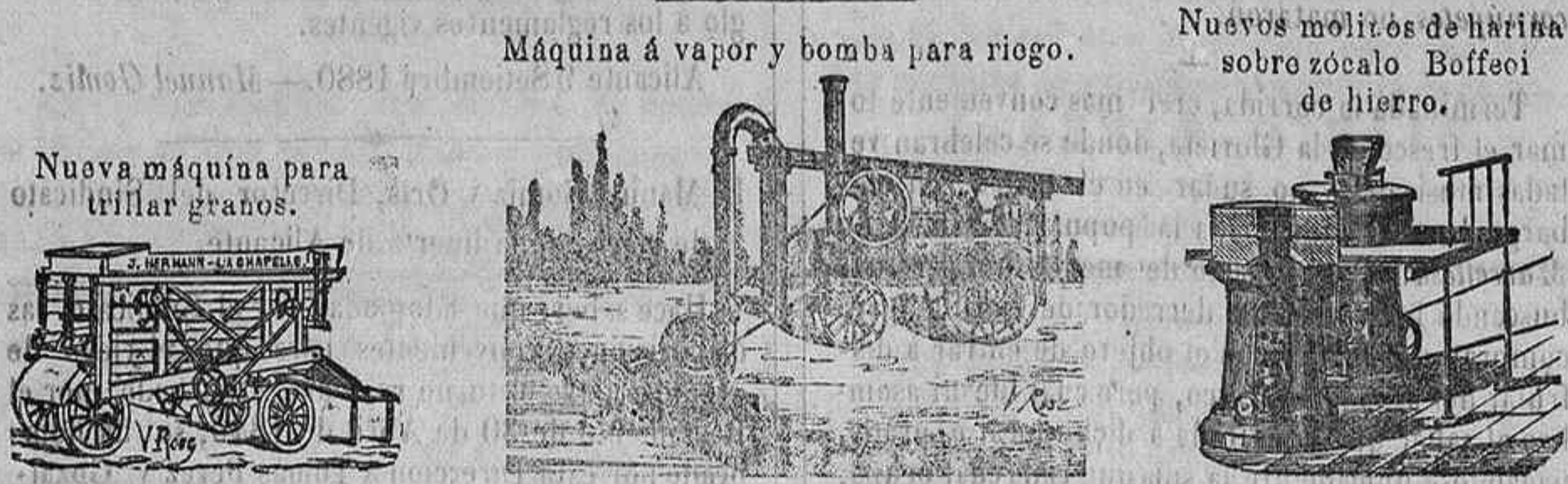
Máquina á vapor y bomba para riego.