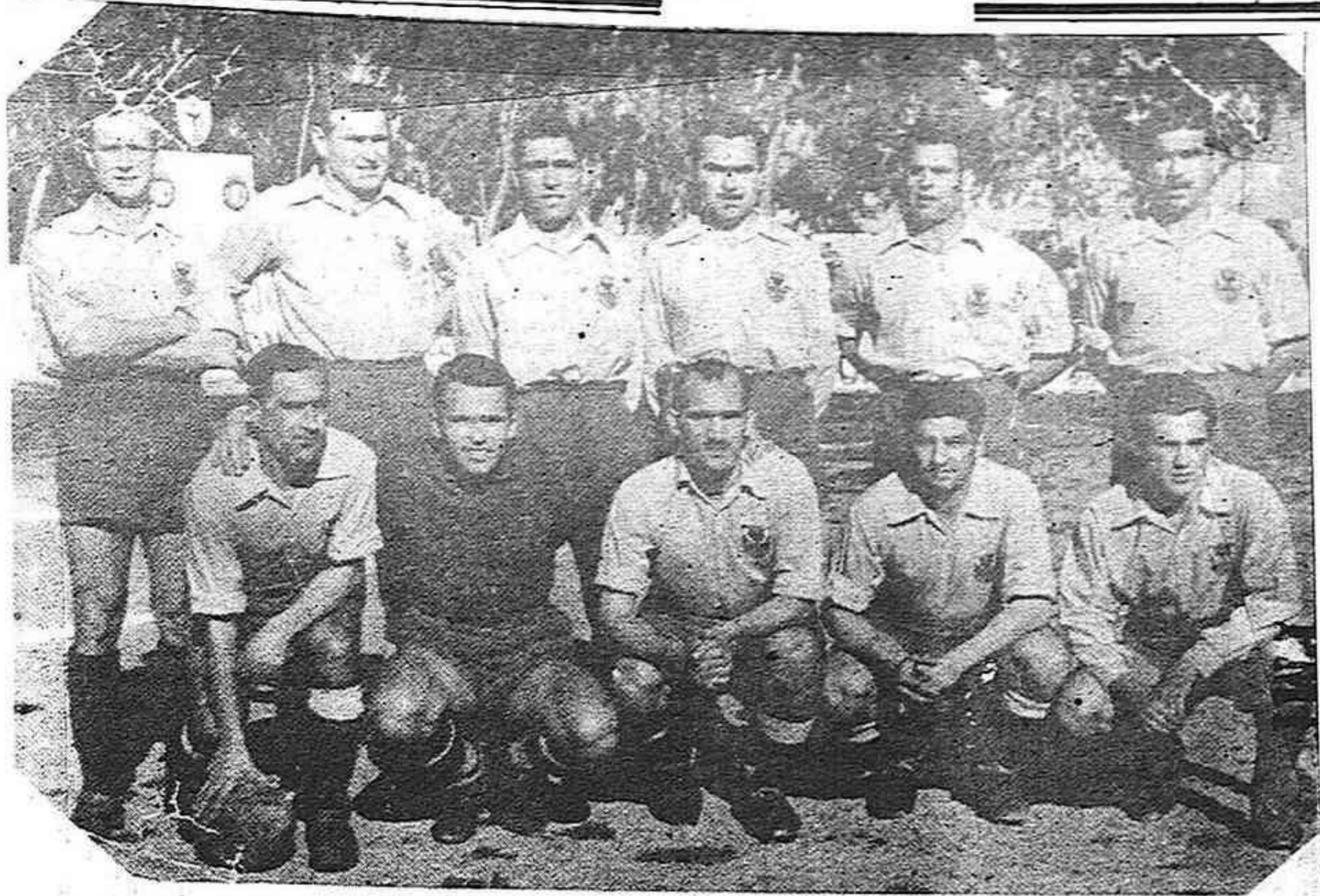
DOS FORMACIONES DEL ORIHUELA DEPORTIVA