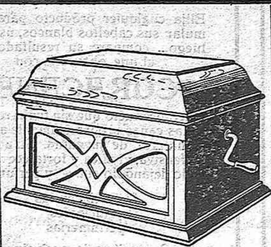
Modelo de mesa, 104