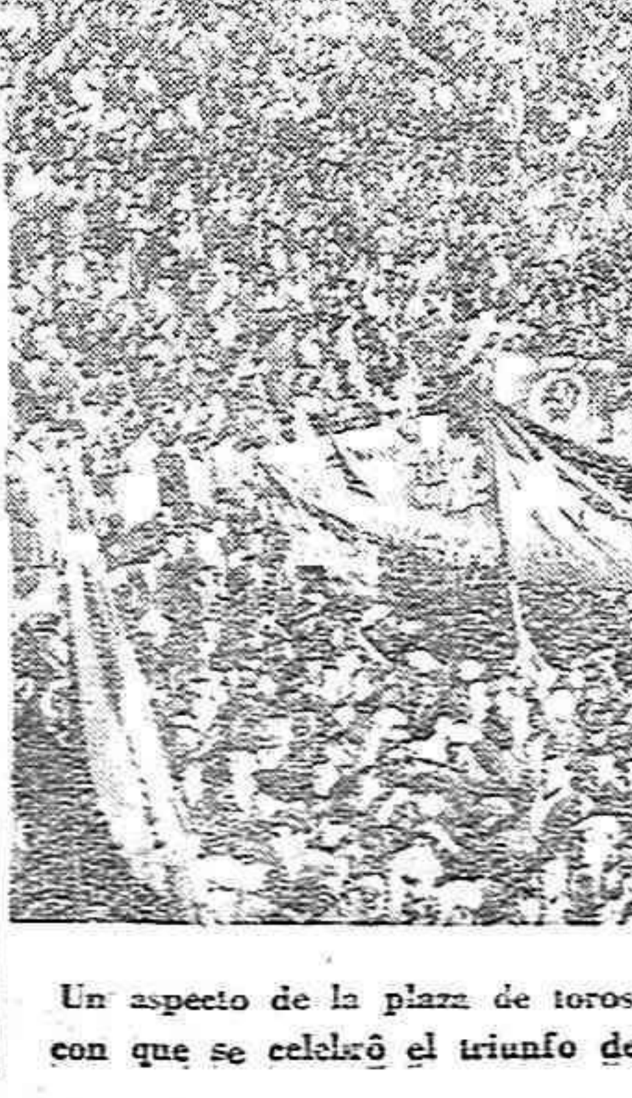
Un aspecto de la plaza de toros de Madrid durante el grandioso mitin con que se celebró el triunfo del Frente Popular en febrero de 1936.