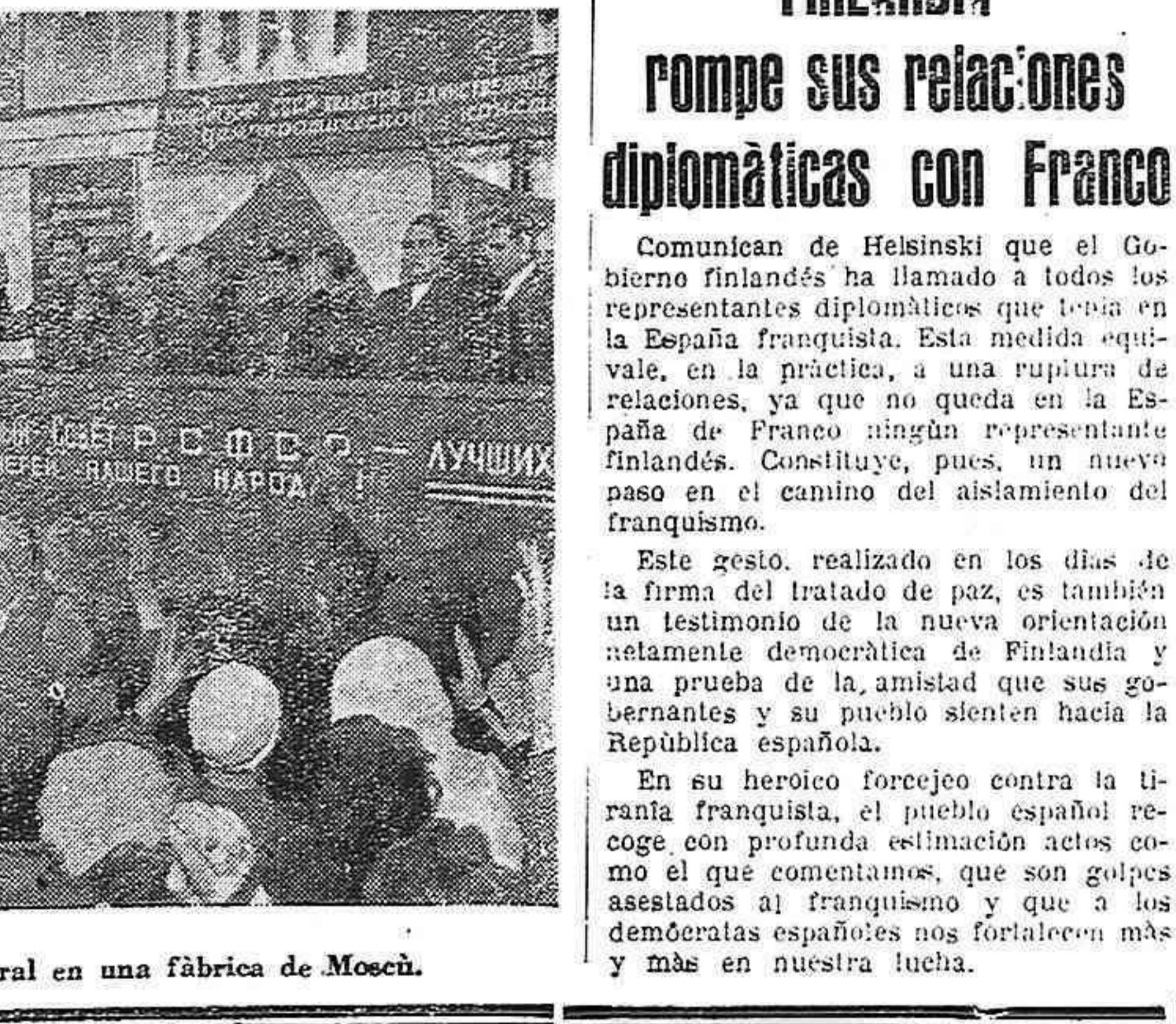
Acto de propaganda electoral en una fábrica de Moscú.

En su heroico forcejeo contra la tiranía franquista, el pueblo español recoge con profunda estimación actos como el que comentamos, que son golpes asestados al franquismo y que a los democratas españoles nos fortalecen más y más en nuestra lucha.