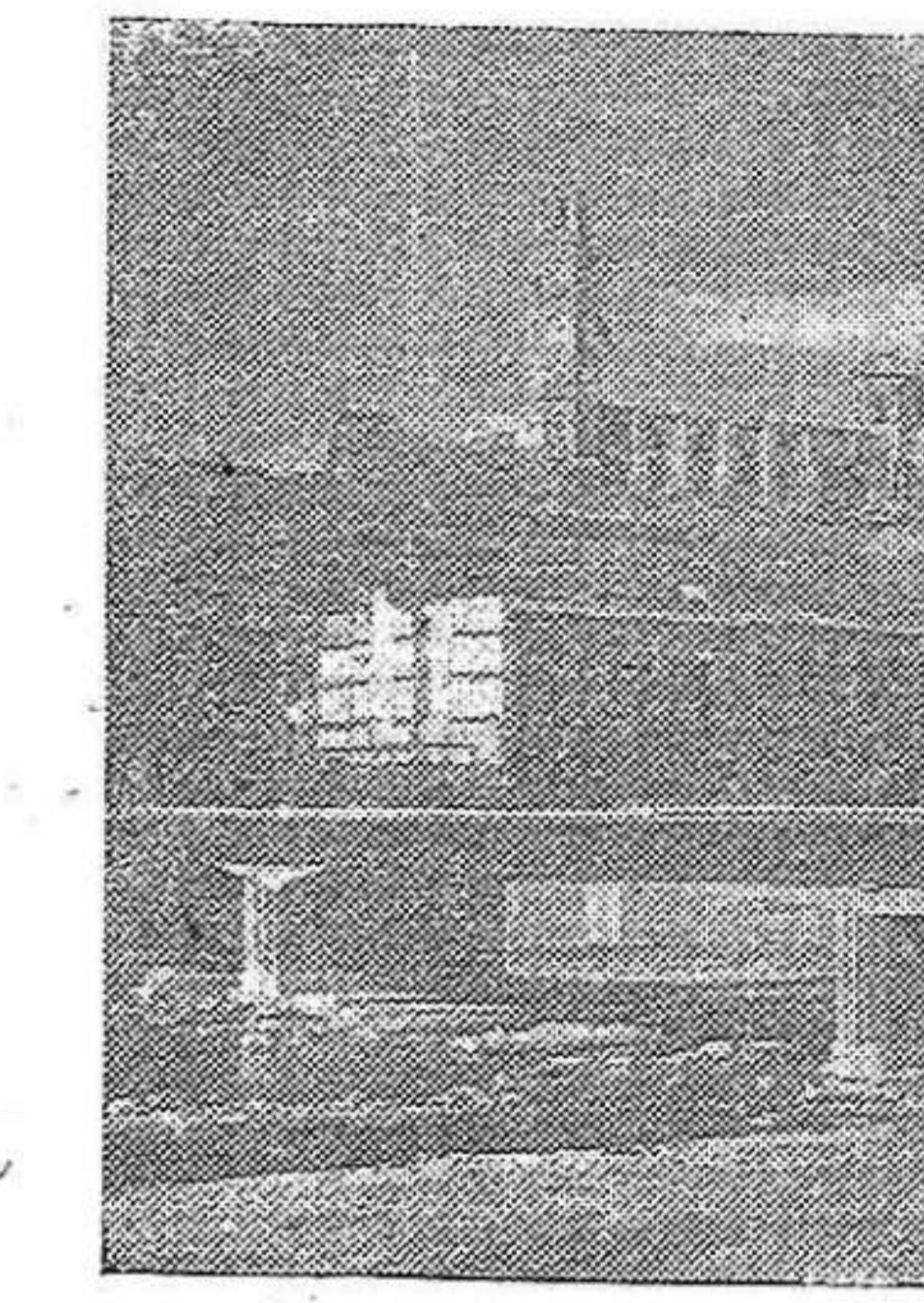
ufana públicamente de que sus gastos de mano de obra disminuyen considerablemente, mientras la producción aumenta.

Corchera Extremeña: Con la misma máquina, un obrero que antes realizaba en un día 1.500 flotadores de red, realiza ahora 4.000 flotadores. La empresa se