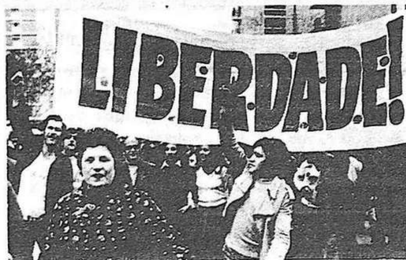
EL POBLE PORTUGUÈS CELEBRA LA LLIBERTAT

Una primera conclusió a treure de l'experiència de Portugal és que si la dictadura salazarista es va fondre com un bolado tan aviat com l'Exèrcit li va retirar el seu suport, la dictadura franquista -no menys odiada pel poble que la