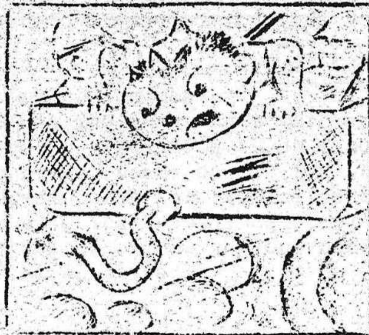
2. Contempla con gran coraje que se aleja su equipaje.