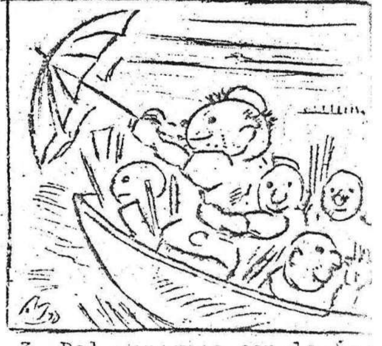
3. Del paraguas con la tela hace "una barca de vela".