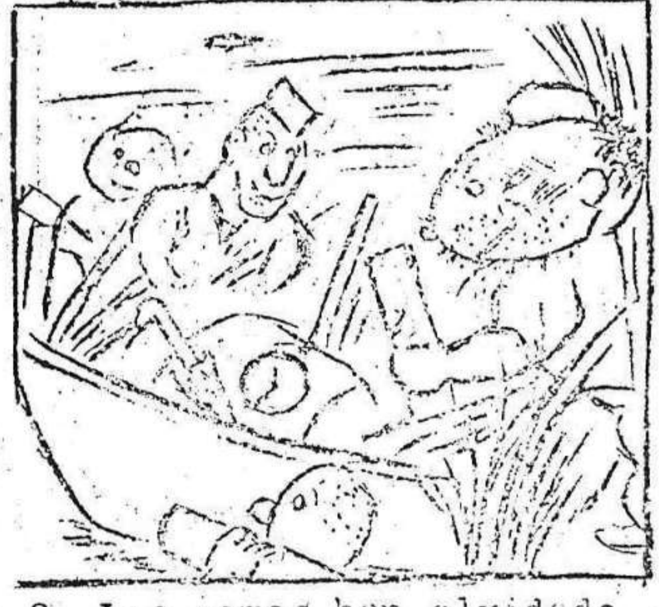
2. Los remos han olvidado y la barca se ha parado.