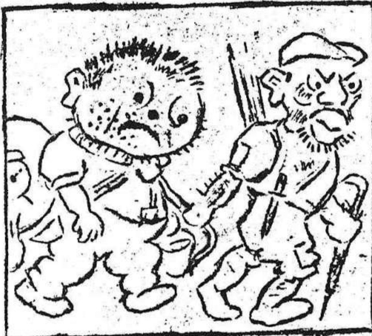
1. Otros moros alertados a "MACUTO" han apresado.

AVENTURAS DE "MACUTO", primo hermano de Canuto... Nº 10. Prisionero y saqueado.