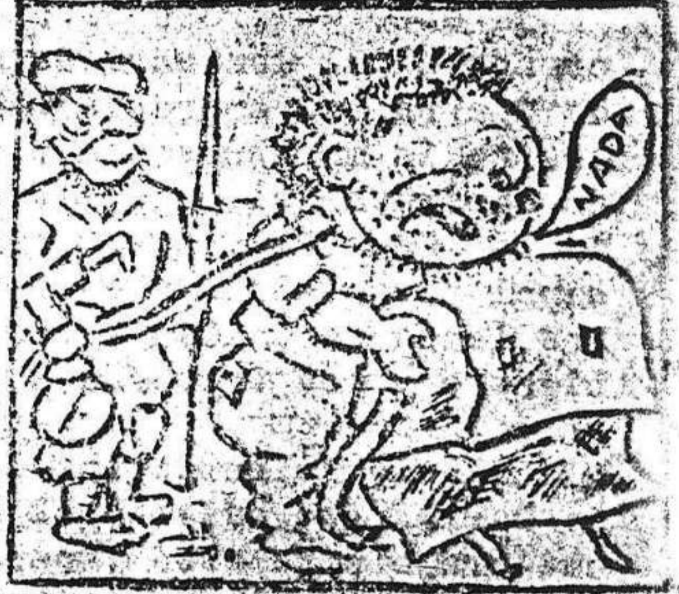
3. Y triste y desesperado, ve que nada ha quedado.