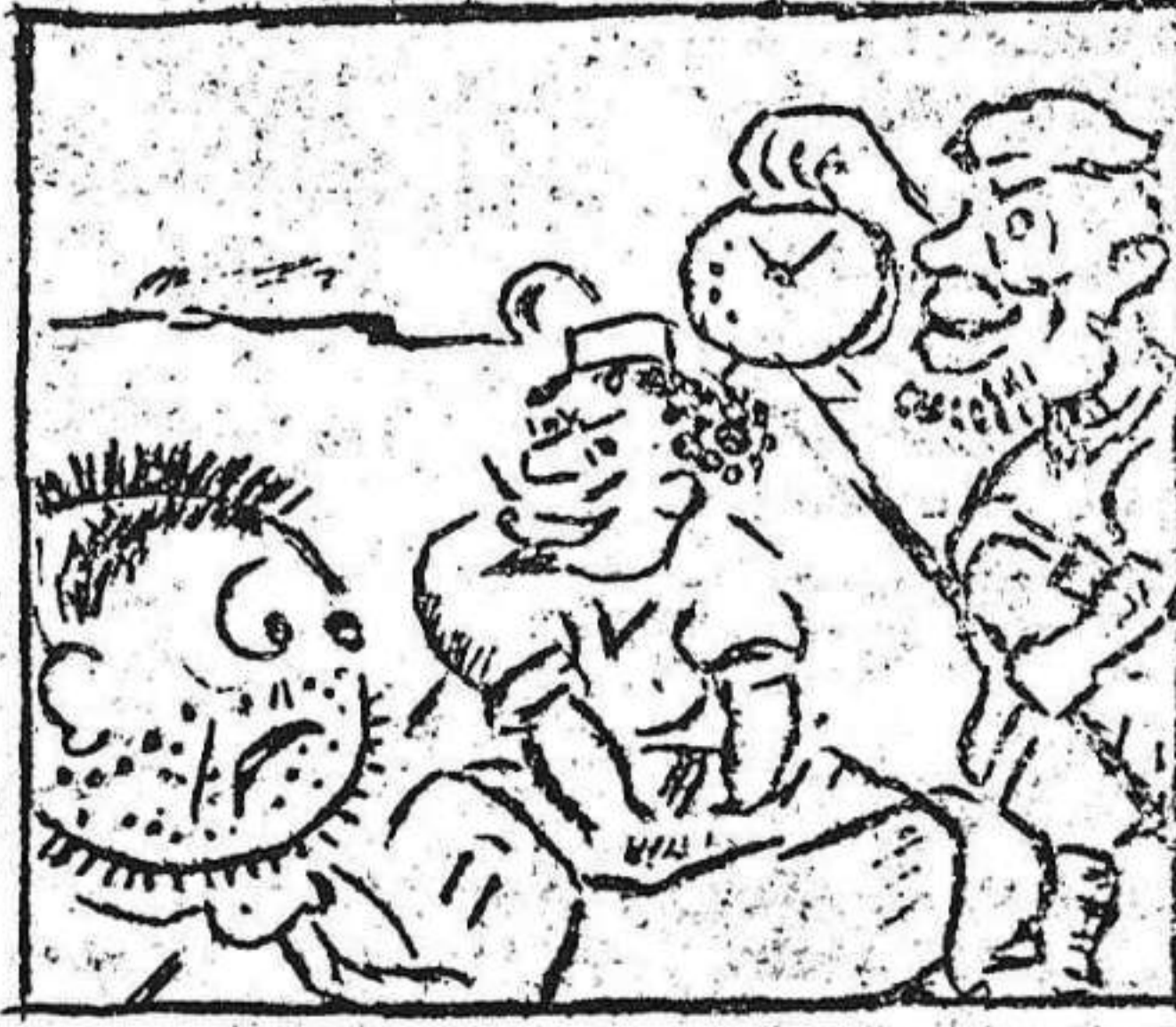
2. "MACUTO" ve con coraje que le roban su equipaje.