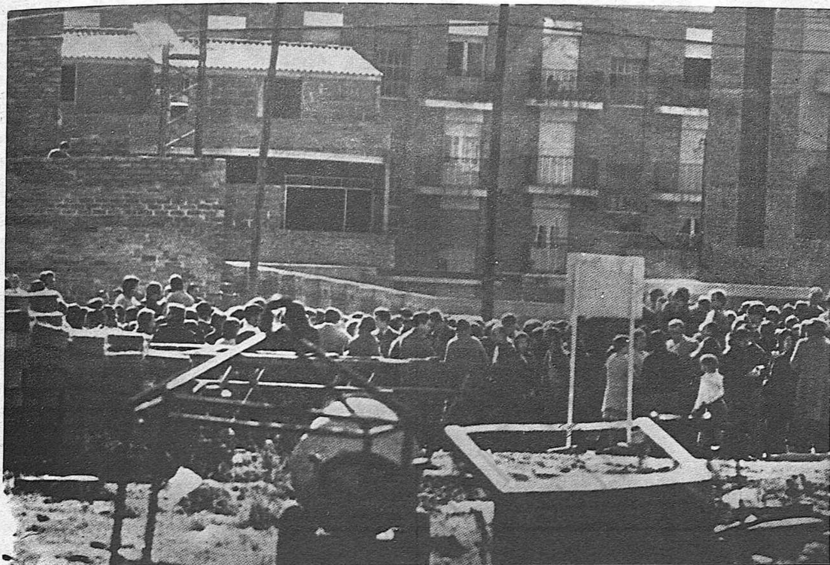
★ 28-1-73.- Seguda a CAN ANGLADA, el diumenge 28 al matí, de més de 500 veïns. Ocupen un terreny destinat a la construcció d'un grup escolar, que és retardada per l'actitud del propietari del solar. Va durar una hora i mitja. Diàleg amb força pública, que no intervingué violentament. El dia 4 s'ha repetit la manifestació, amb 2.000 participants.