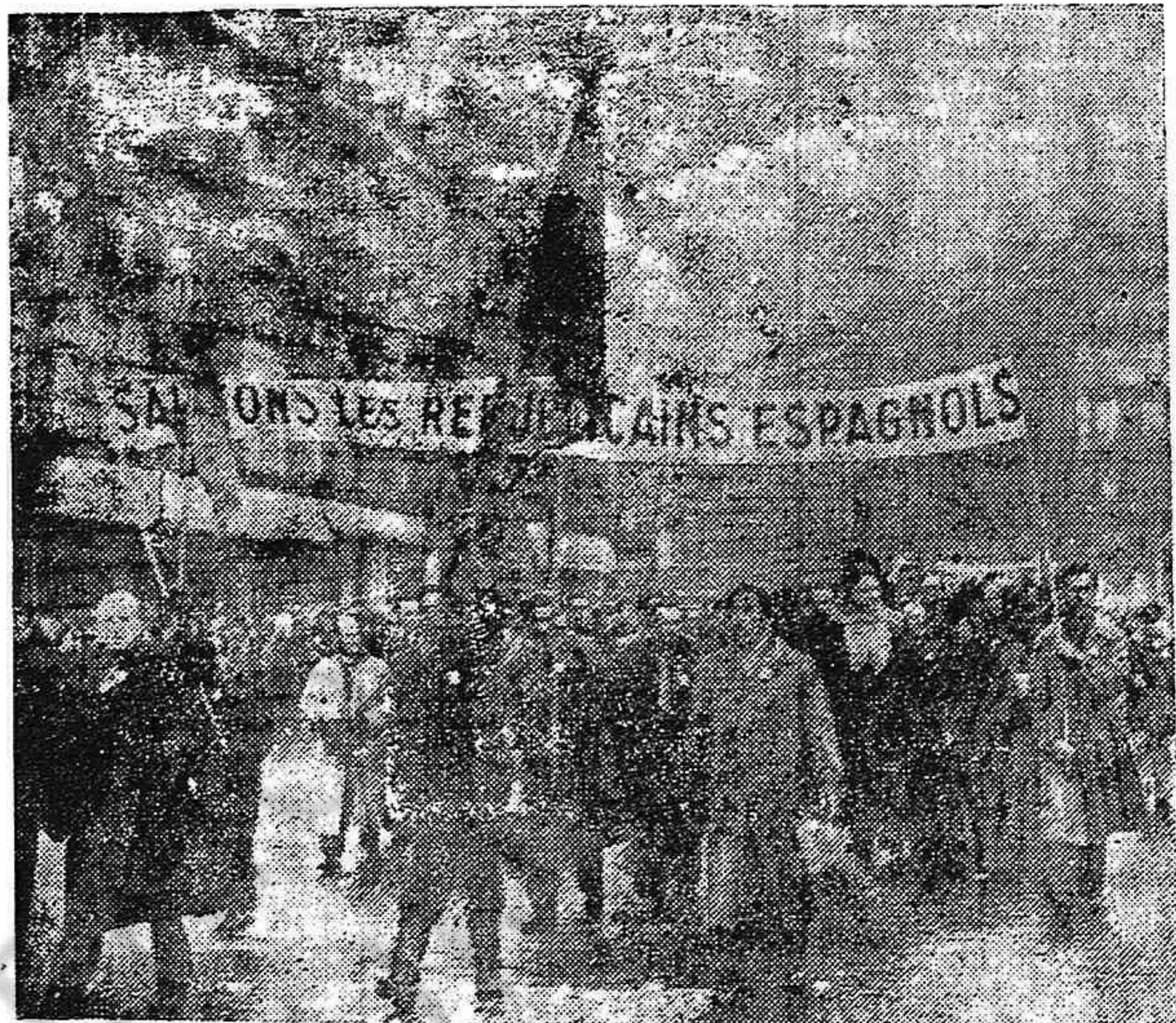
En la inmensa movilización mundial contra el franquismo y en ayuda del pueblo de España, Francia da ejemplo de firme y emocionante solidaridad. En la foto se ve una de las innumerables manifestaciones que en estos días recorren las calles de todas las ciudades francesas saludando a los republicanos españoles.

No son todas estas manifestaciones, aquí reseñadas, un resumen de los actos contra el franquismo, que se están celebrando en el mundo. Pero si indican que la causa del pueblo español, es hoy como lo fue ayer, la causa de toda la humanidad progresiva y avanzada, como calificó el problema español el gran jefe del país soviético, el mariscal Stalin.