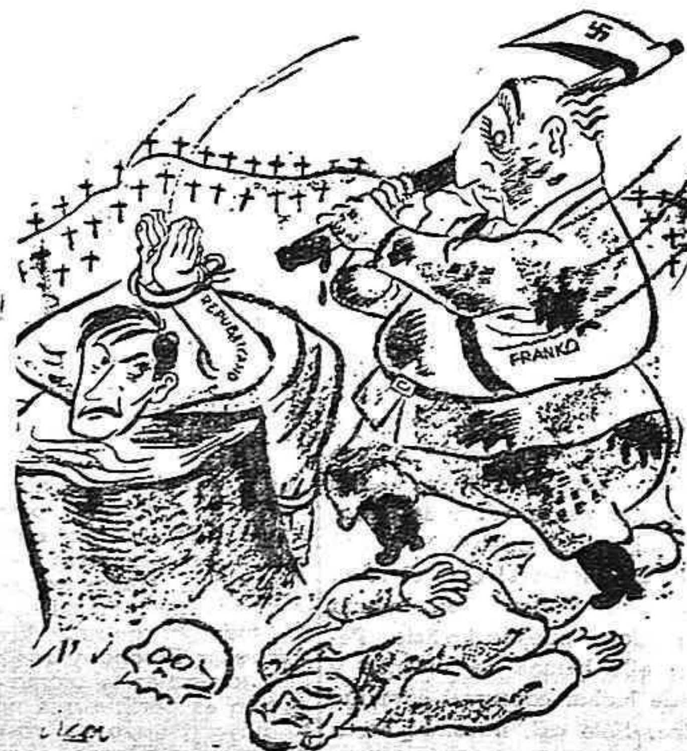
Mar-Car en "HOY" de La Habana.