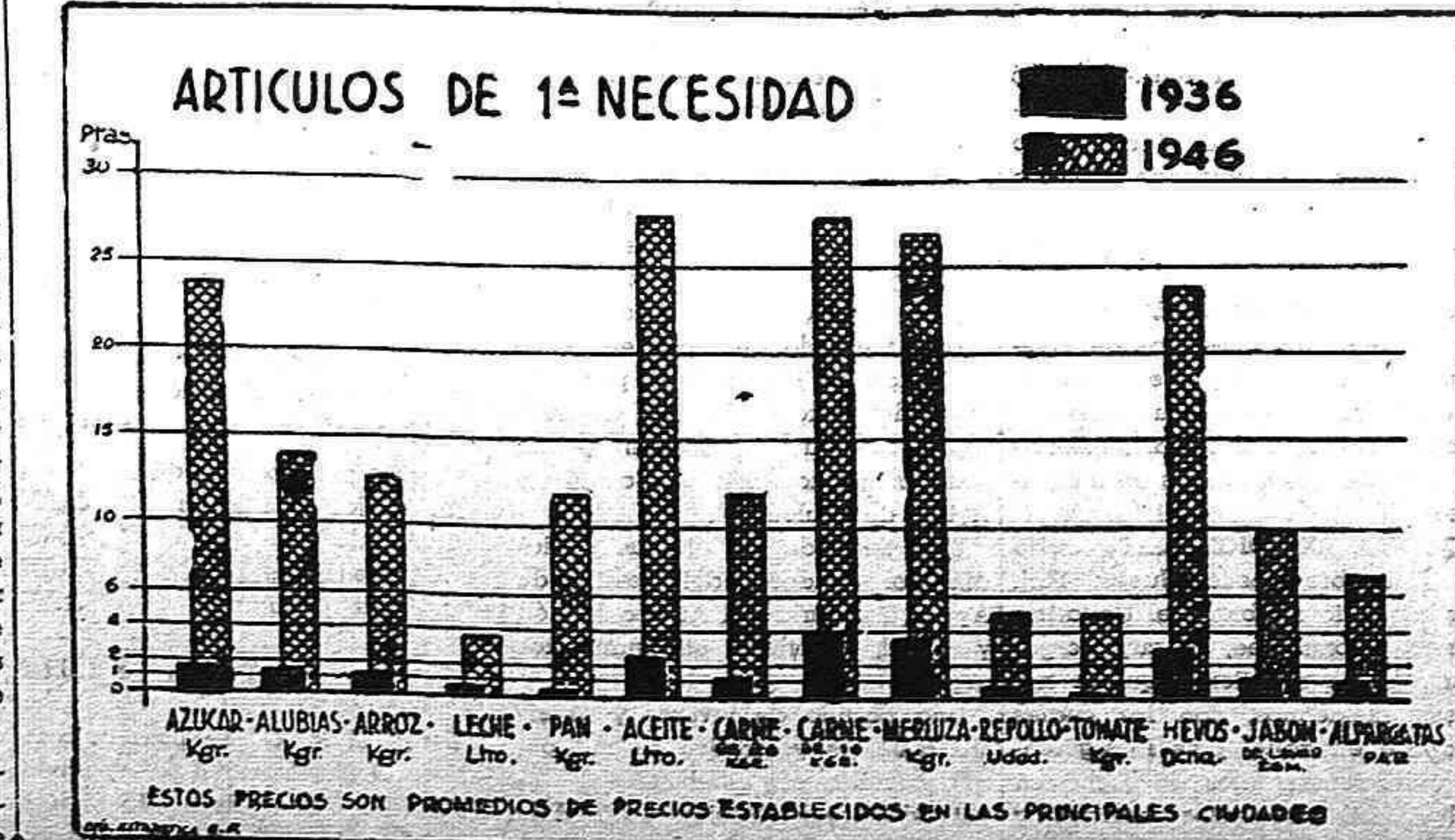
ESTOS PRECIOS SON PROMEDIOS DE PRECIOS ESTABLECIDOS EN LAS PRINCIPALES CIUDADES

Según el racionamiento medio que señalamos, cada persona recibe en alimentos una 1.520 calorías diarias, calculando el pan de composición normal, cosa que no es en la realidad. Esta cifra de calorías, da una idea de la depauperación de los españoles bajo el régimen de Franco, si tenemos en cuenta que lo necesario para un hombre de mediana actividad serían unas 3.000 calorías. De esta forma, se condena a los españoles a una muerte lenta y angustiosa que les lleva a realizar verdaderos milagros para la obtención de algún alimento más, conseguido de "straño modo", con que poder cubrir aunque mal, las deficiencias tremendas que desde el punto de vista de necesidad alimenticia indispensable, presenta el racionamiento que se da en España.