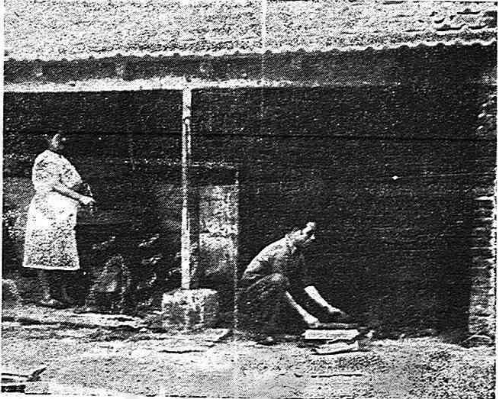
La difícil situación de muchos de nuestros compatriotas en Francia está aún muy lejos de haber sido remediada. Véase la pobreza de la "cocina de verano" del Hospital "Varsovie" de Toulouse, en el que están recogidos algunos de nuestros compatriotas enfermos.

Los envíos del Comité de Ayuda Sanitaria van dirigidos al Unitarian Service Committee, quien los distribuye de acuerdo con las necesidades y con el asesoramiento y colaboración de un Comité de Españoles en el que participan hombres de todas las ideas políticas, así como hombres apartados de la disciplina de partidos políticos.