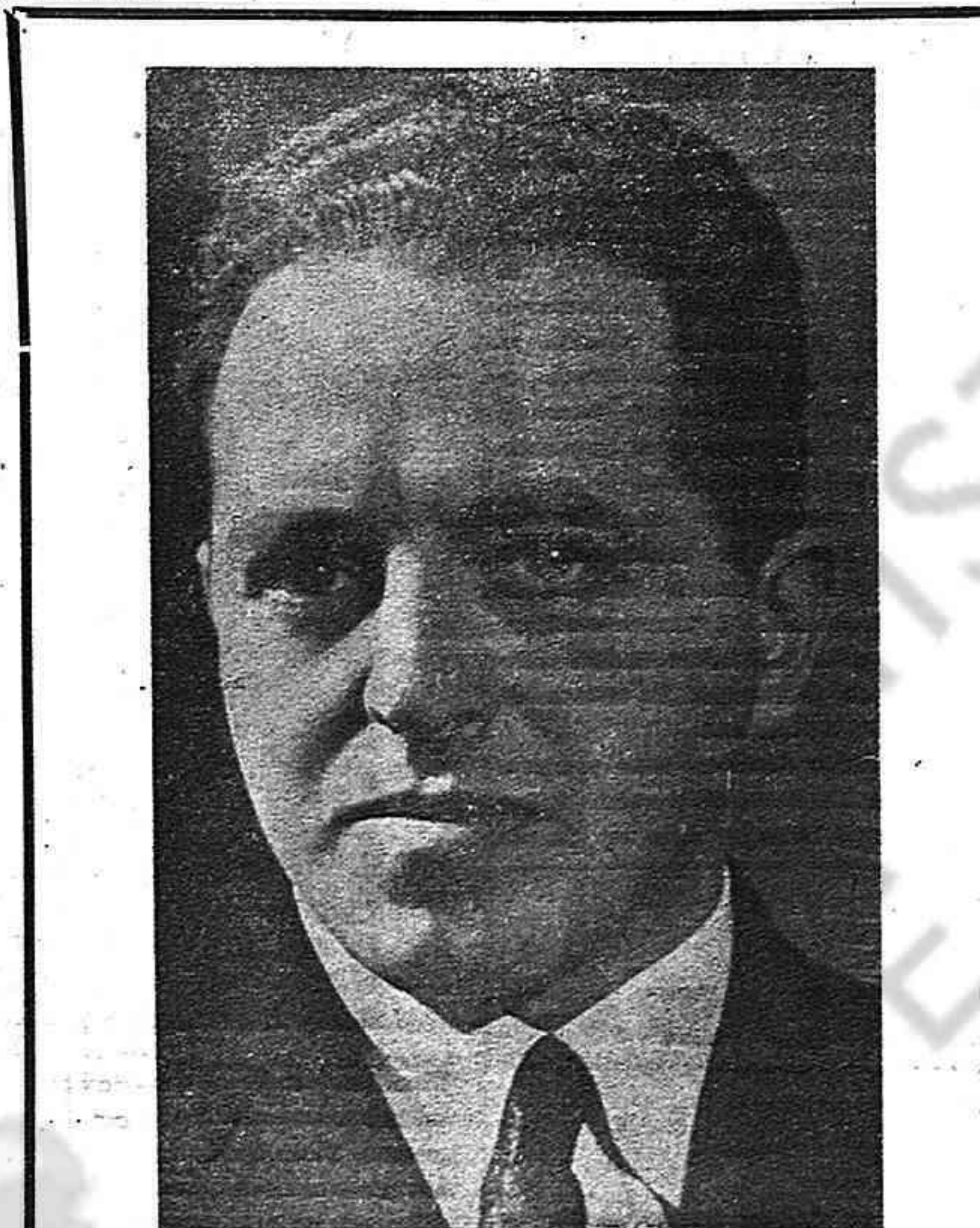
CONSTANTINO A. OUMANSKY, magnifico hijo de la Unión Soviética y del Partido Comunista (B) de la URSS. Al cumplirse, el 25 de enero último, el primer aniversario de su muerte, en tierras de México, recordamos con dolor su noble figura, dotada de las más altas cualidades y entre las que ocupaba lugar preeminente su amor por la causa de la liberación de España.

Milán. —En la Federación del Vidrio y la Cerámica de Milán, los comunistas obtuvieron 18,945 votos, los socialistas 12,765 y los demócratas cristianos 4,276. En la FIOM (metalúrgicos) de Génova el resultado fué de 25,159 los comunistas, 9,591 los socialistas, 2,760 los demócratas cristianos, 1,149 los republicanos, 1,491 los comunistas libertarios y 713 el Partido de Acción. En la FIOM, en la ciudad de Asti, los comunistas obtuvieron 1,644 votos; los socialistas 390; los internacionalistas 226; los demócratas cristianos 169 y los del partido de Acción 66.