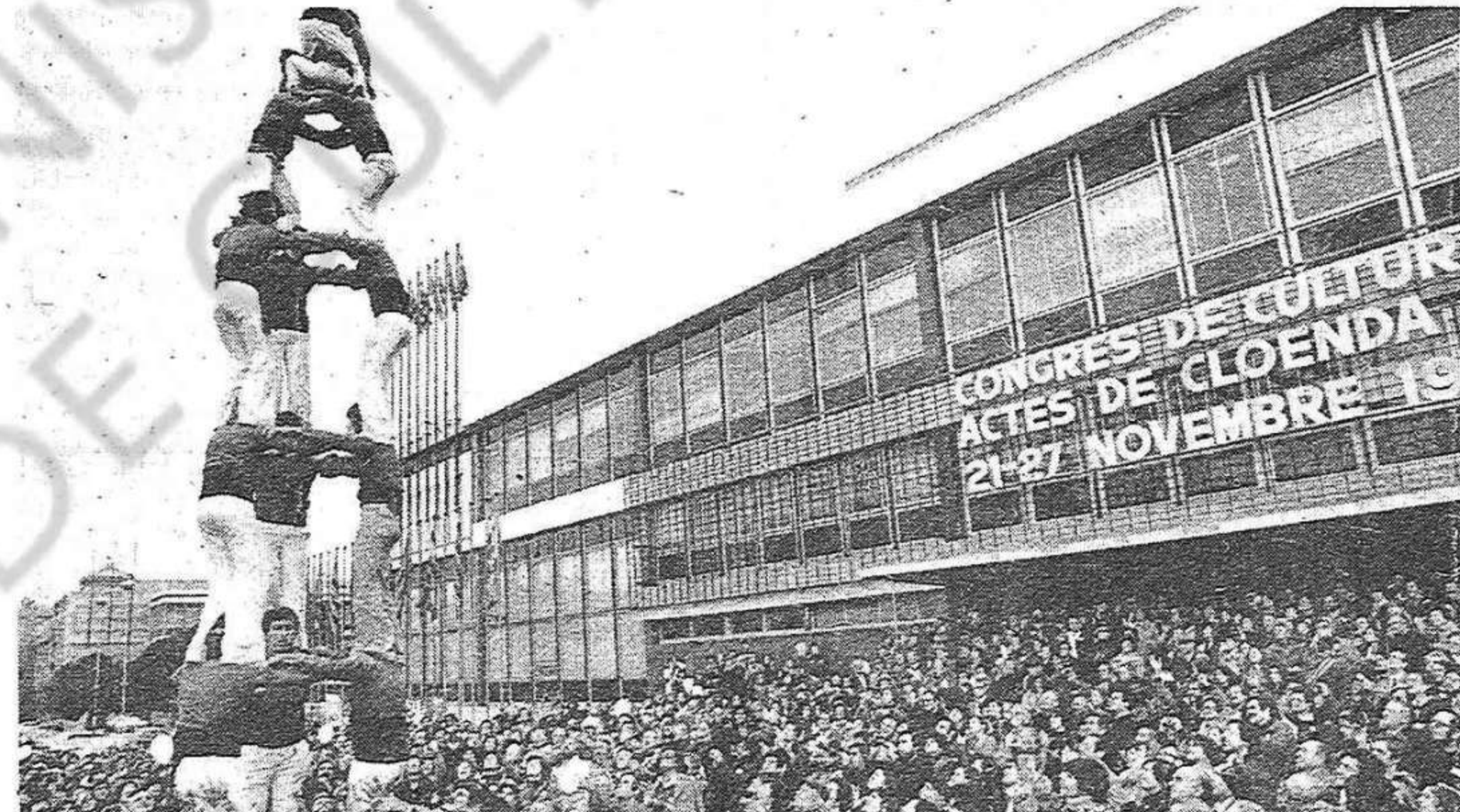
El·ls actes de cloenda del Congrés de Cultura Catalana. Un Congrés que ha contribuït al procés de recuperació de la nostra identitat nacional.