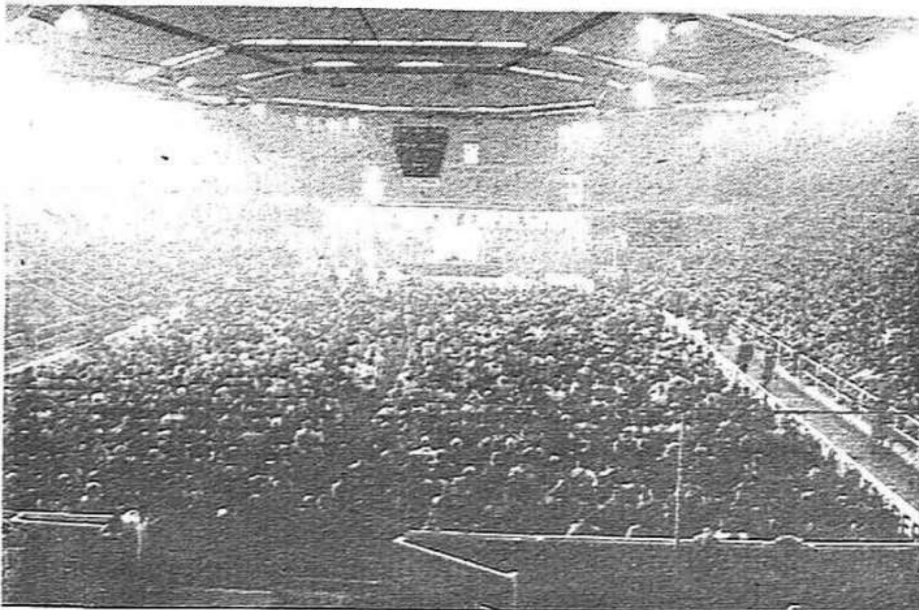
A les fotos de Jordi Soteras, dos moments de la concentració d'empresaris

"Aquest acte és un atac a la política del govern i concretament al Pacte de la Moncloa. Però allí no es va oferir cap alternativa a canvi. S'està en desacord en una sèrie de punts del pacte. No estan conformes que la crisi s'hagi de repartir entre tots. Ja els anava bé com fins ara, que la crisi anava carregada damunt d'uns determinats sectors socials. Quan es parlà d'una lenta reforma fiscal —a molts, només de sentir-la anomenar, se'ls ericaren els cabells—, es parlà de la manera europea d'aplicar-la, però no es va dir que als altres països europeus les empreses no porten doble comptabilitat, com encara fan molts aquí. Fins ara, pagar impostos feia riure; ara, però, amb els canvis resten sobtats..."