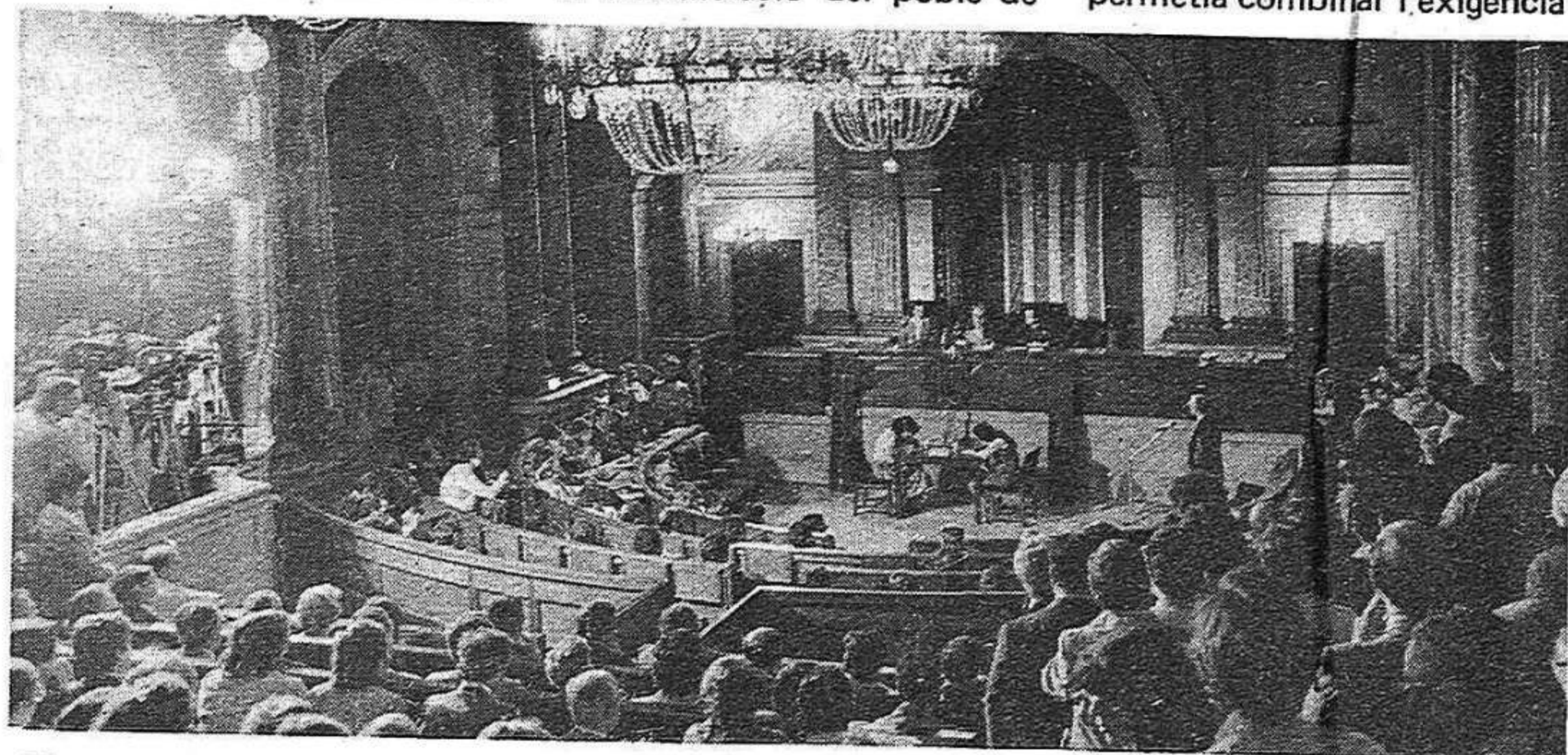
Els acords de Perpinyà estableixen que el Consell Executiu serà nomenat "d'acord amb els diputats i senadors"