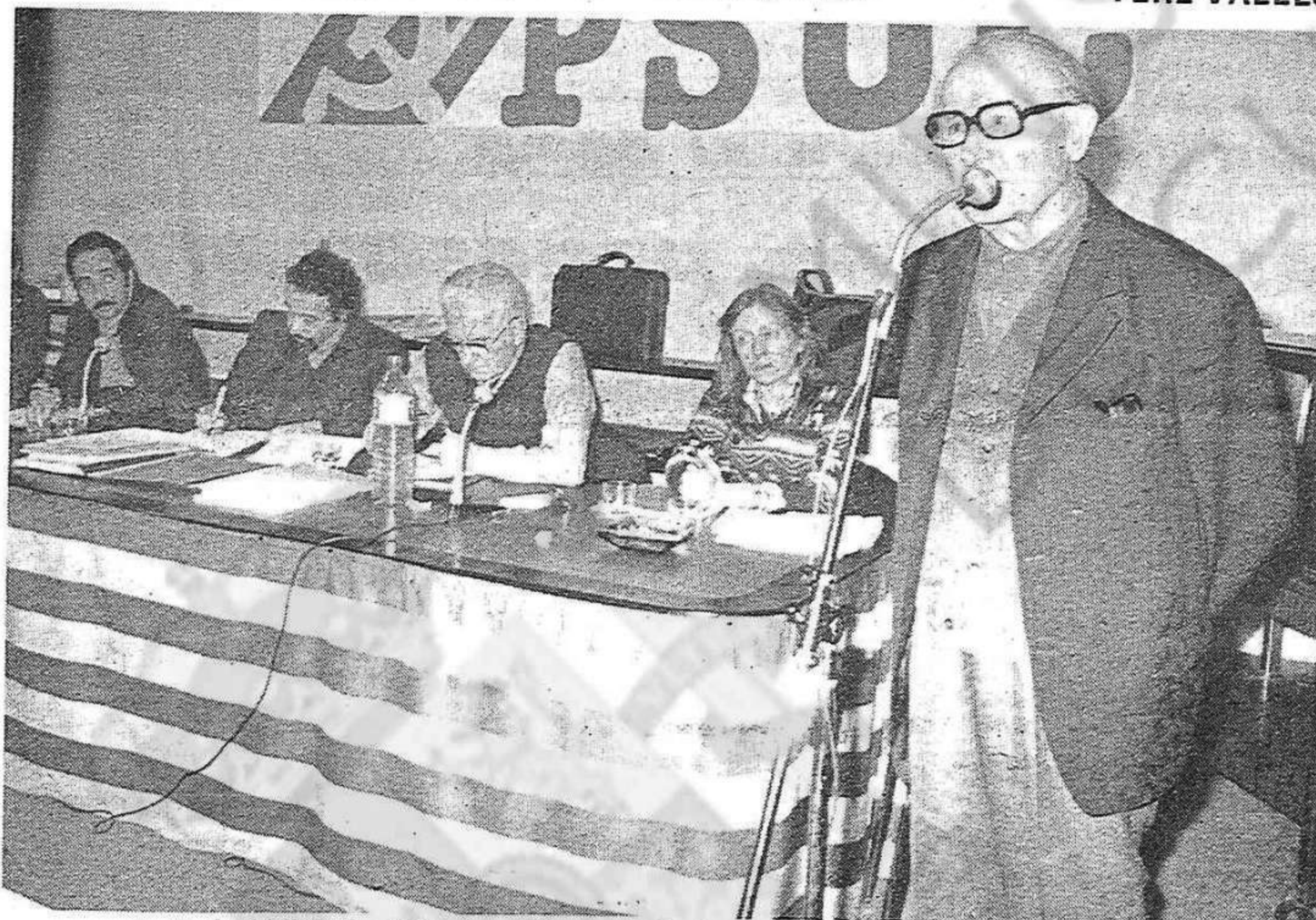
Rafael Vidiella: "Tenim el Pacte de la Moncloa a la gorja i l'hem de pair"