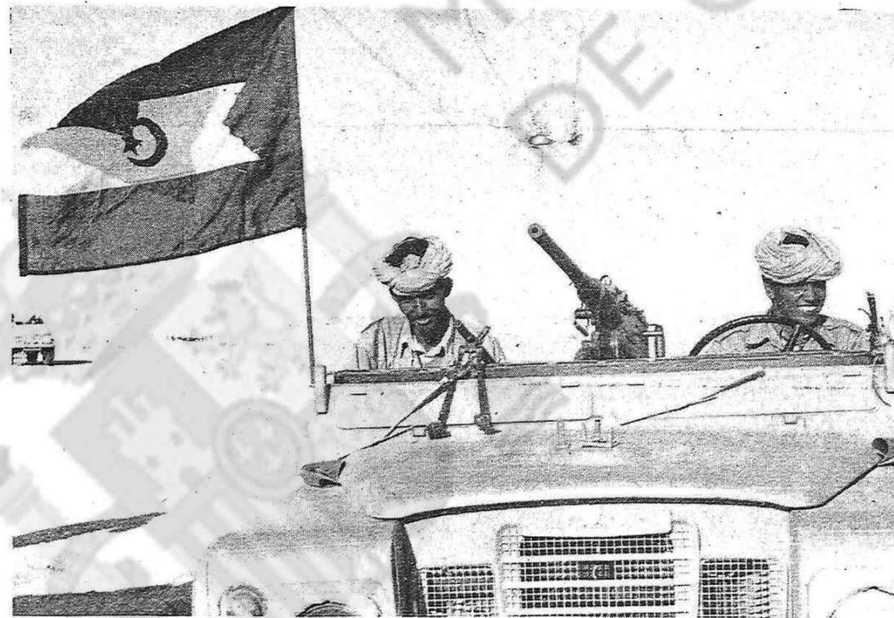
El Sàhara, un tema viu.

Però, tant sí com no, venia a posar sobre la taula un cop més la necessitat que s'obri una profunda investigació de la situació dels penals espanyols. Una situació que, en recents sessions plenàries del Congrés de Diputats i del Senat, fou qualificada de gravíssima i davant la qual es va acordar, en ambdues cambres, crear una comissió especial de parlamentaris, els treballs de la qual no es poden demorar. Perquè, com va dir en aquella ocasió el senador basc Joan Maria Bandrés "els ulls dels presos comuns estan fets en el Parlament..." I el que cal ara, a partir d'aquesta investigació de la comissió creada al respecte, és començar a aplicar una nova política penitenciària que, d'alguna manera, suposi un retrobament amb la iniciada en els temps de la segona República per la llavors director general de presons Victòria Kent.