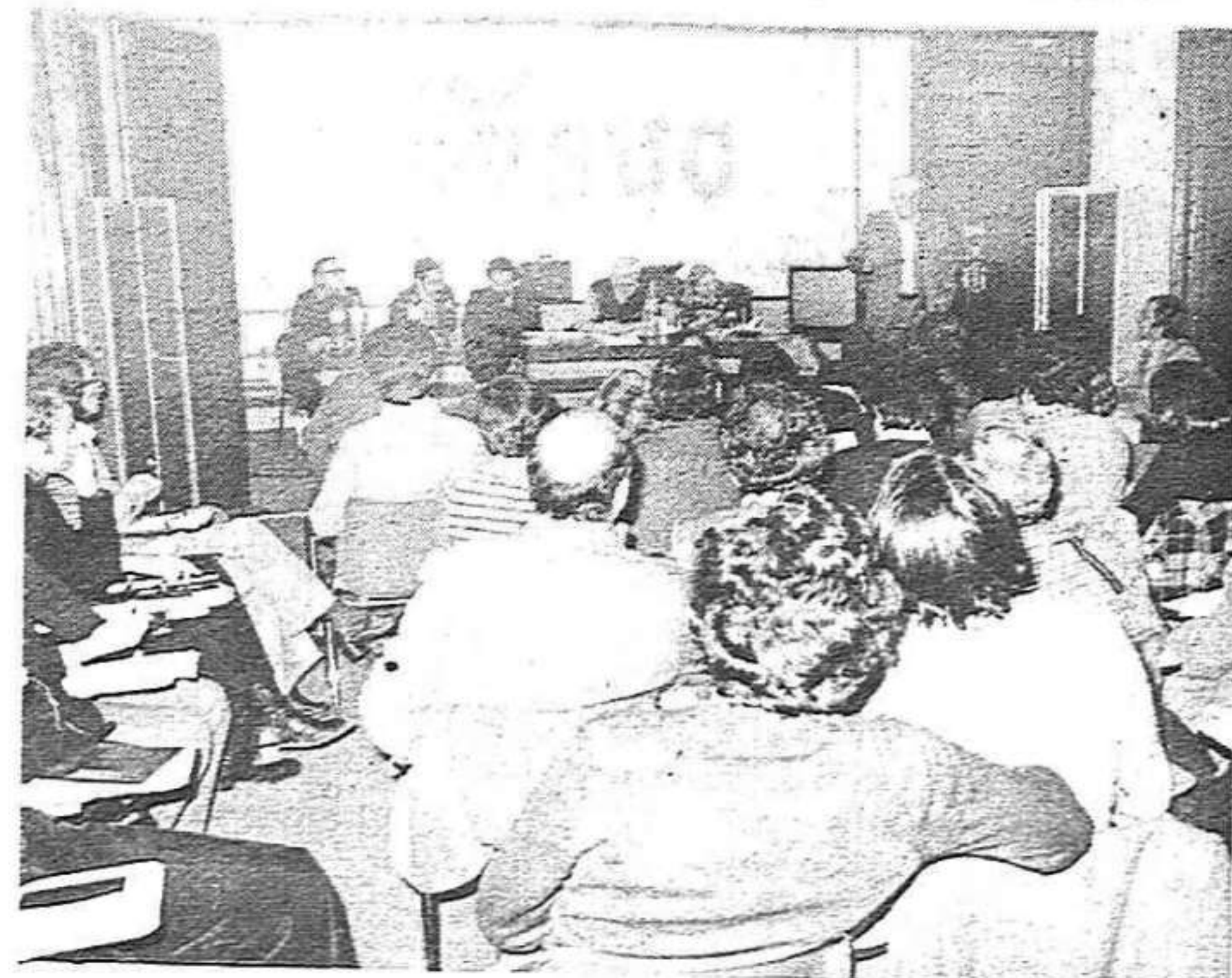
Un moment de la reunió