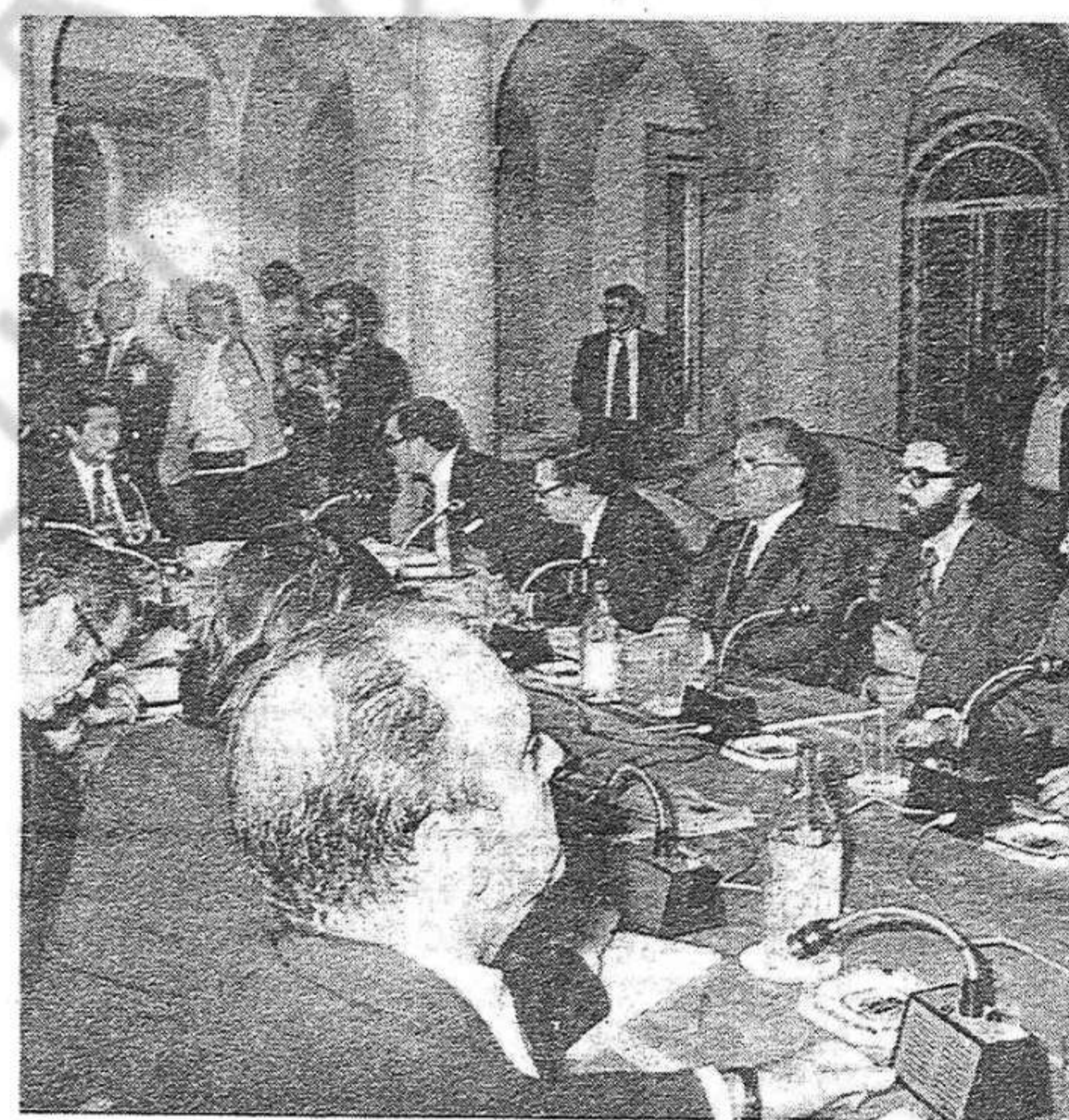
Cal una nova reunió dels signataris del Pacte

Finalment, la declaració del PCE subratlla la necessitat d'una entesa entre comunistes i socialistes i demana una trobada amb el PSOE.