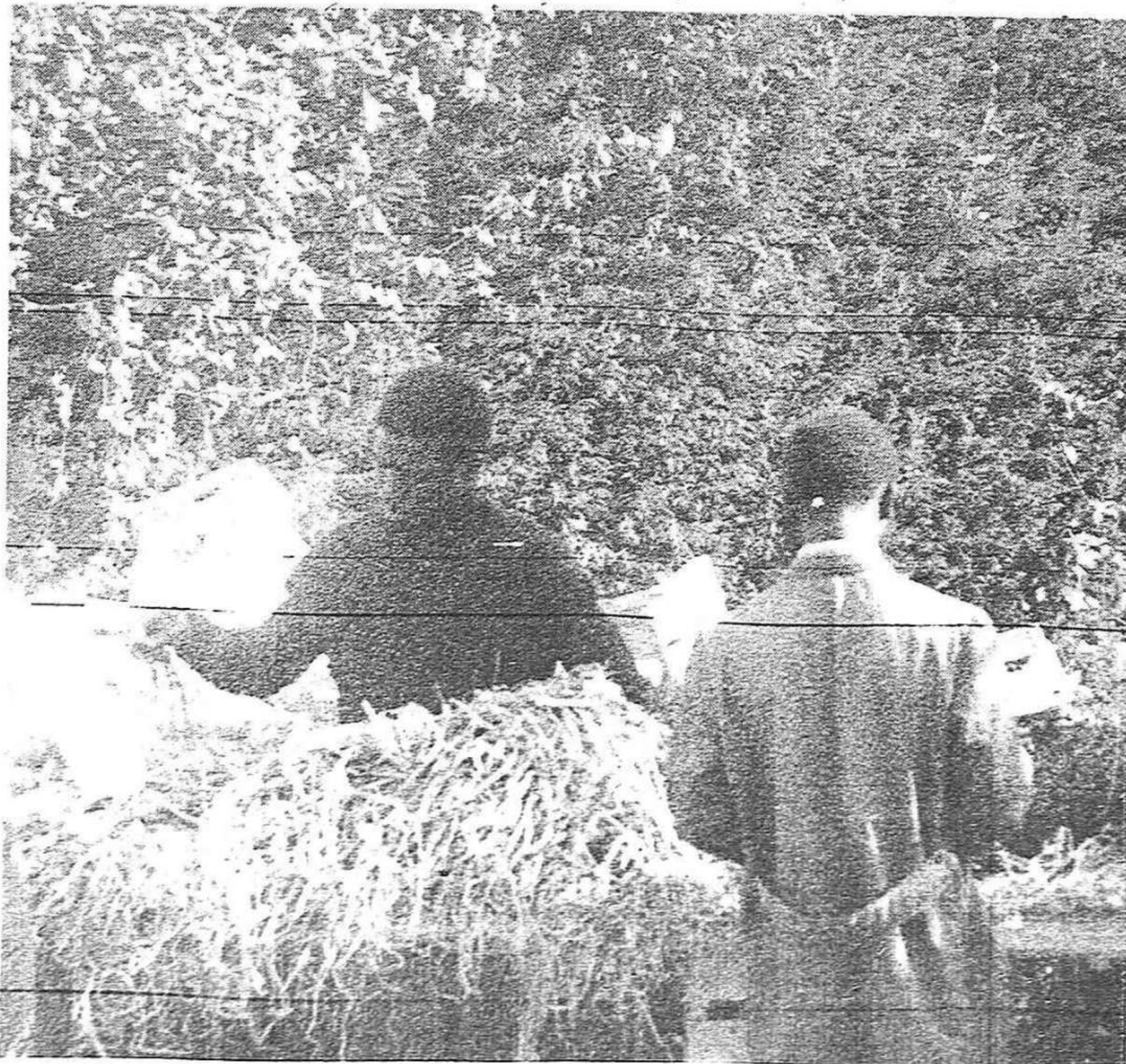
Africans sense feina fan de pagès al Maresme

barata opten per llogar-la. El problema és complex. Els pagesos no tenen la culpa que aquests treballadors no tinguin permís de treball, però alguns s'aprofiten d'aquesta circumstància per explotar-los de manera desenfrenada. Hi ha qui diu que aquests homes no haurien d'ésser acceptats mentre existeixi l'excés de mà d'obra actual a la comarca. No hi ha cap dubte, tanmateix, que es troben en una situació extremadament injusta que reclama una solució urgent. Abans que res són persones i han de ser tractats com a persones.