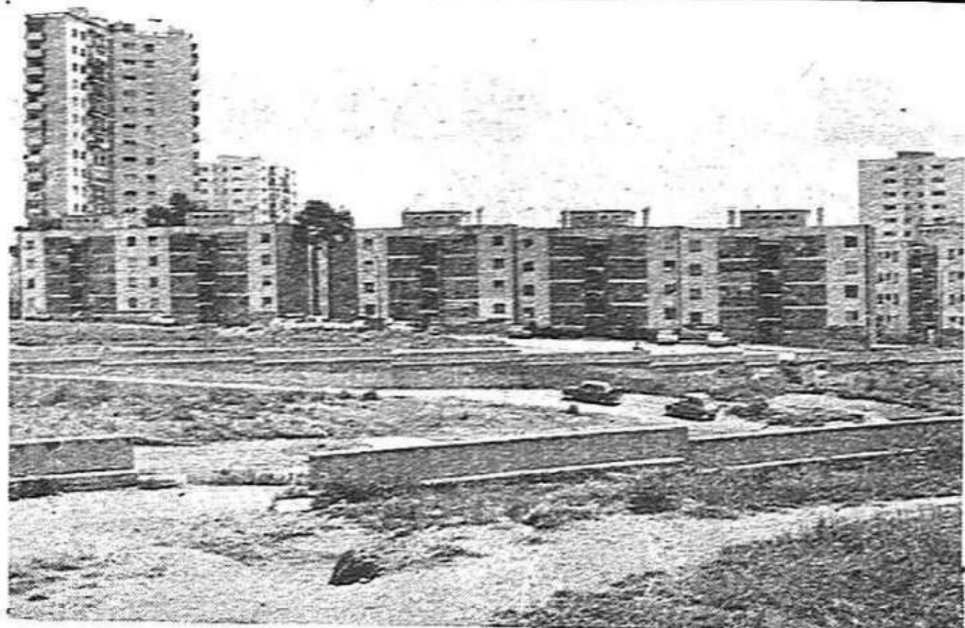
Els pisos de l'OSH: vivendes que no serveixen

gència la necessitat de fer una ràpida gestió política al més alt nivell possible amb la finalitat d'intentar obrir les portes de l'Administració i aconseguir aquelles coses que en depenen. En aquesta direcció s'han realitzat una sèrie de gestions a través dels parlamentaris del PSUC en primer lloc i també amb d'altres partits. Concretament, se sap que el secretari general del PSUC, Antoni Gutiérrez, va fer gestions amb el governador civil, que va dir que estava disposat a rebre una comissió de Terrassa per tal de concretar urgentment una entrevista amb en Martín Villa. A aquesta reunió, que possiblement se celebri aquesta mateixa setmana, hi assistiria una comissió formada per cinc representants de partits polítics, tres de centrals sindicals, tres de la patronal, dos d'associacions de veïns, l'alcalde i dos regidors. S'hi presentaria un document, elaborat per totes les comissions que hi treballen i que ja hem esmentat abans, recollint les coses principals que necessita urgentment la ciutat.