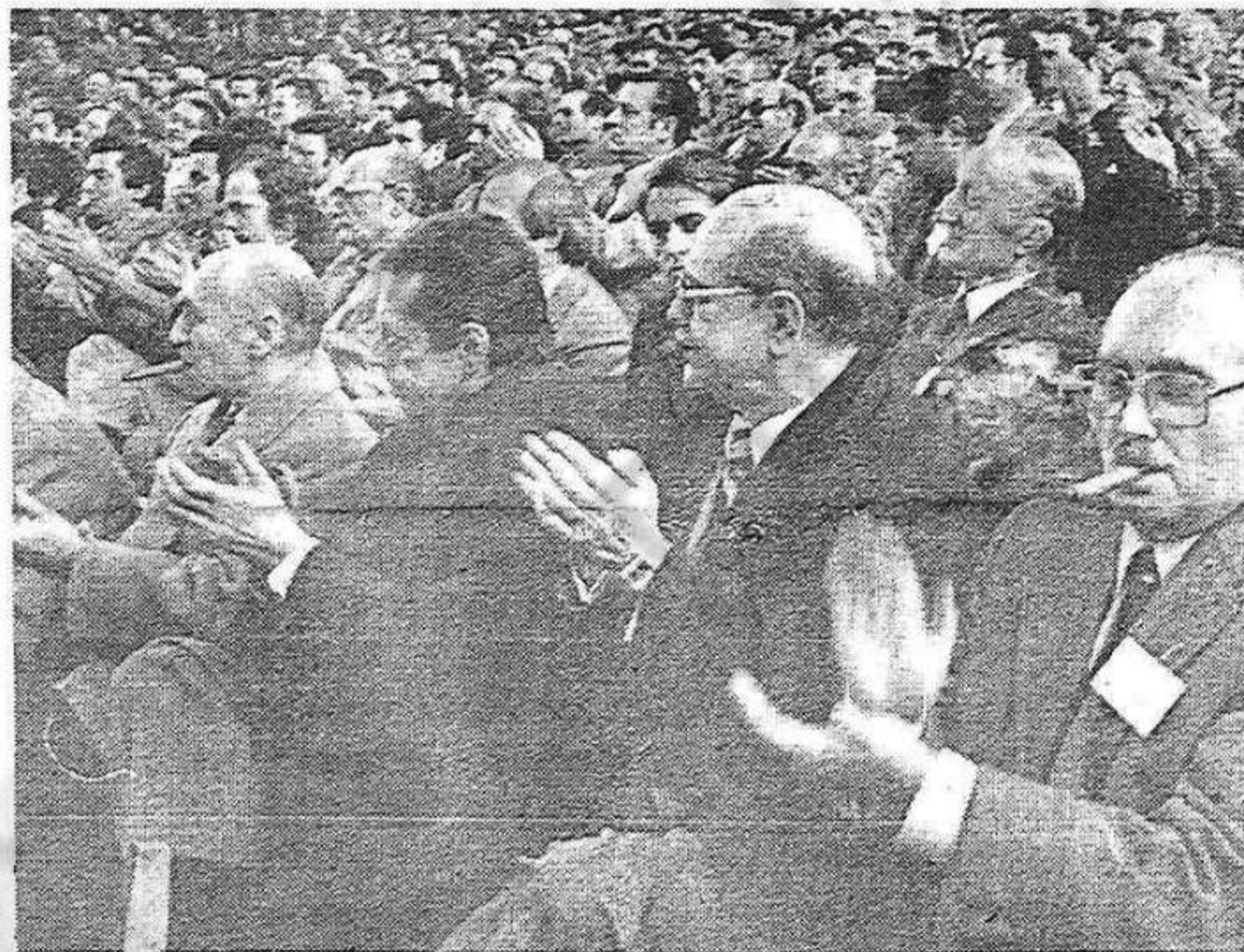
Patrons contra el Pacte de la Moncloa

Hem parlat de centenars de milers de treballadors immigrants que no van poder expressar-se el passat mes de juny i això ens porta a fixar-nos en l'anunciada celebració, per aquest final de setmana, del "Dia d'Andalusia", que vol commemorar-se també a Barcelona i altres poblacions de Catalunya. Evidentment, es tracta d'una celebració que, a Catalunya, esdevé complexa i, en qualsevol cas, és motiu de reflexió. Catalunya com a col·lectivitat —que inclou els catalans d'origen i els catalans d'adopció, autòctons i immigrants— ha de ser extraordinàriament solidària amb tots els pobles d'Espanya, amb les nacionalitats històriques i amb les regions en les quals la consciència de poble