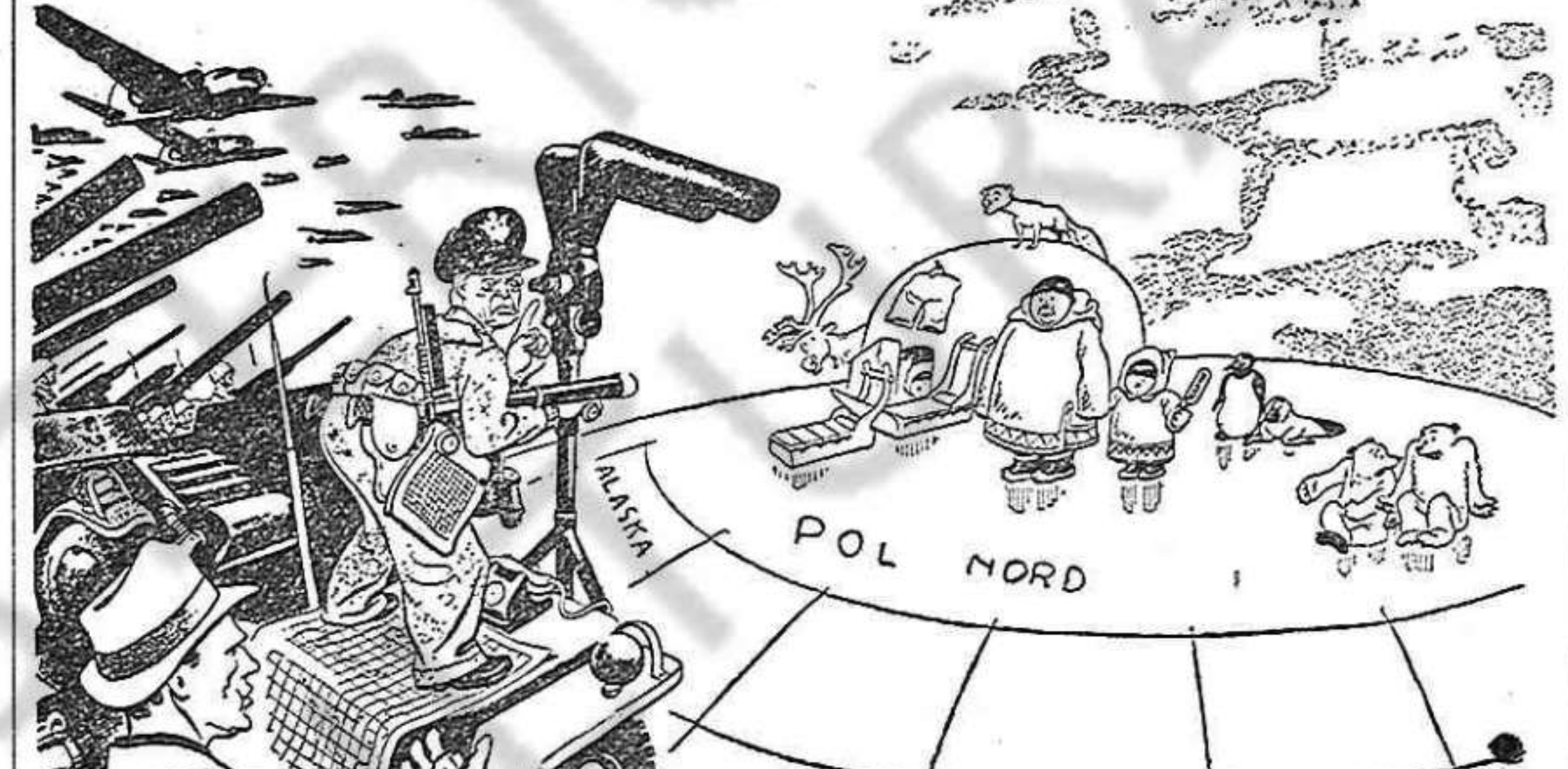
El ciutadà americà. — Què passa general? Per què tanta preparació bèl·lica en aquesta regió tan despoblada?

MOBILITZACIO MUNDIAL CONTRA FRANCO! (Ve de la pàg. 1.) «Nosaltres diem que no n'hi ha prou de constatar i descriure les situacions que canvien i es creen.»