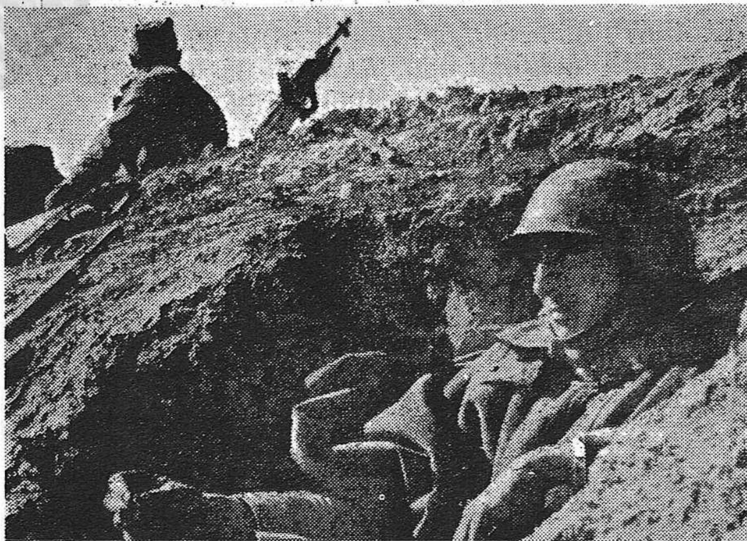
Un puesto en el frente

Ayer mañana Madrid pudo contemplar cómo la Aviación republicana echaba abajo a dos trimotores de los que vienen a asesinar mujeres y niños. La batalla aérea se llevó a efecto ante los ojos de miles de madrileños que seguían con entusiasmo las arrojadas acometidas que los "cazas" republicanos hacían objeto a los potentes trimotores fasciosos. Uno de los aparatos fué a caer por las inmediaciones del Retiro, y el otro por el Puente de Vallecas. Naturalmente que el aviador de este último, que se arrojó con paracaídas, era extranjero.