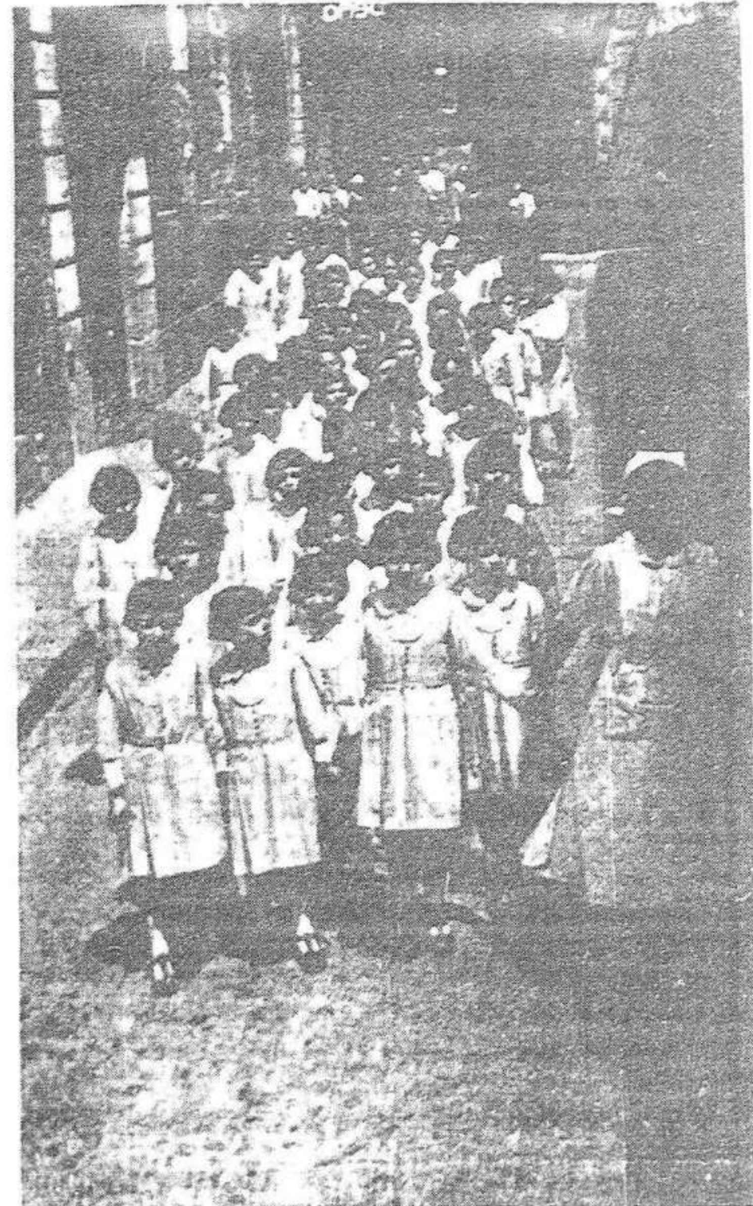
Aquesta és una altra posició conquistada aquests dies. Tanmateix, les noies de la Casa de Caritat no semblen pas massa preocupades per haver perdut les patilles que les dirigien.