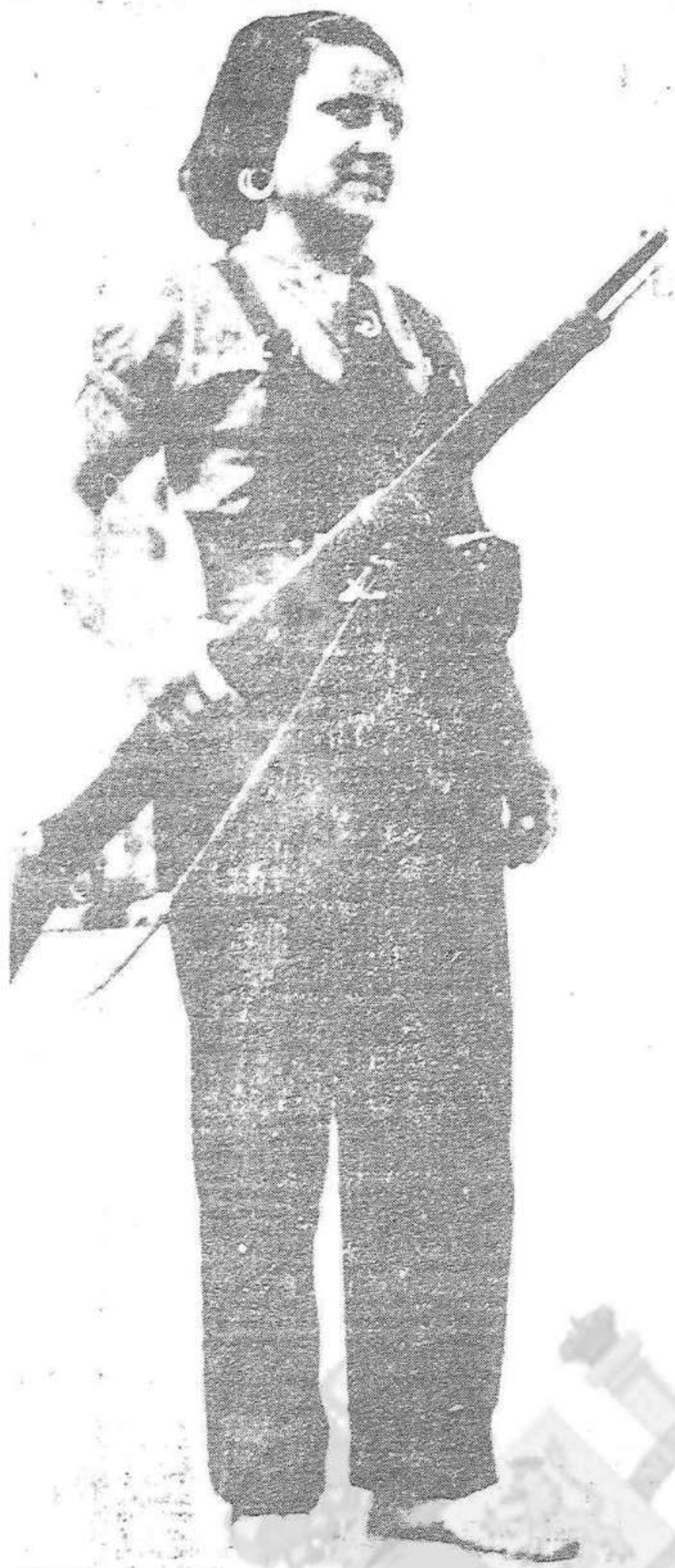
Una de les mileres combatents que han donat una nota altament simpàtica amb la seva presència. És la representació autèntica de la dona que es mobilitza ja el 16 de febrer