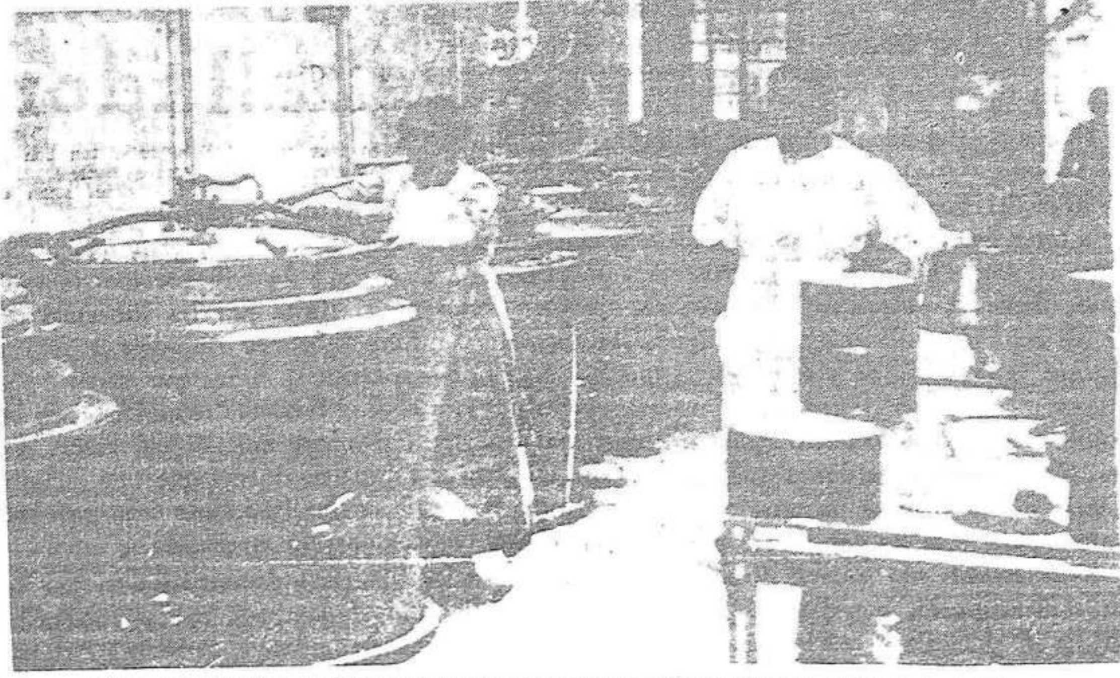
Milers de dones s'han presentat a fer les feines pesades de donar menjar als milicians de la llibertat

Dones de Barcelona! Per a avui dijous, a les set de la tarda, al local del Partit (ex-Cercle Equestre), Passeig de Gràcia, 34, són convocades totes les camarades a una reunió important per a l'organització del moviment femení a la nostra ciutat. Per la victòria definitiva contra el Feixisme! Pel triomf de les forces populars! NO HI MANQUEU