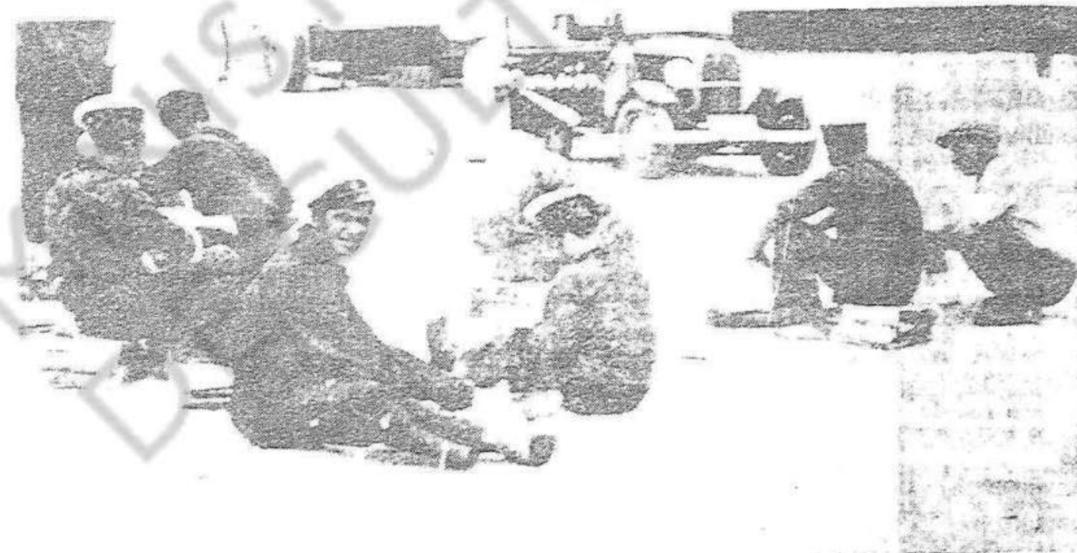
Abans d'aixecar el vol l'avió de càstig, els mariners antifeixistes fan paquets de premsa que assemblaran els rebels la trista situació on què es troben.

A LA CONQUISTA DE MALLORCA En un dels avions que van a Mallorca van embarcar-nos-hi nosaltres. Volíem veure de prop el que ens havien contat el dia abans. Amb la màquina fotogràfica carregada i disposats a treballar, vam sortir de Barcelona. El nostre hidro portava bombes de deu quilos i gran abundància de diaris. Vam bombardejar l'illa amb metralla i amb periòdics, que de vegades són tan interessants com les bombes. A Palma