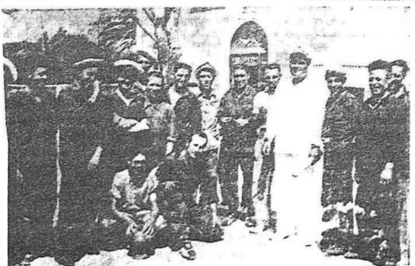
Majoria de la base de Maó que ha restat fidel al poble i a les institucions que s'han donat democràticament

ELS TRIBUNALS POPULARS SON ELS UNICS QUE PODEN FER JUSTIÇA ALS FEIXISTES DETINGUTS.