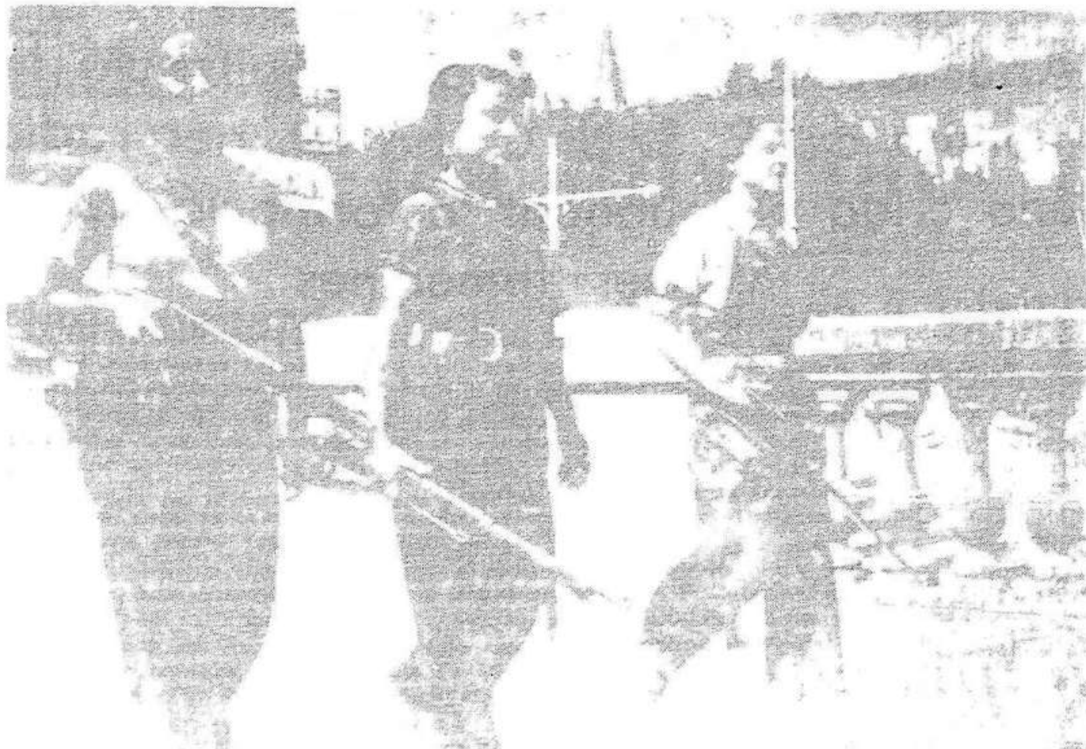
Les dones han format a primers rengles en les unitats militars. Aquesta és una de les unitats de la cavalleria. Amb el fusell a la mà, s'han batut tan bravament com els seus germans de classe.