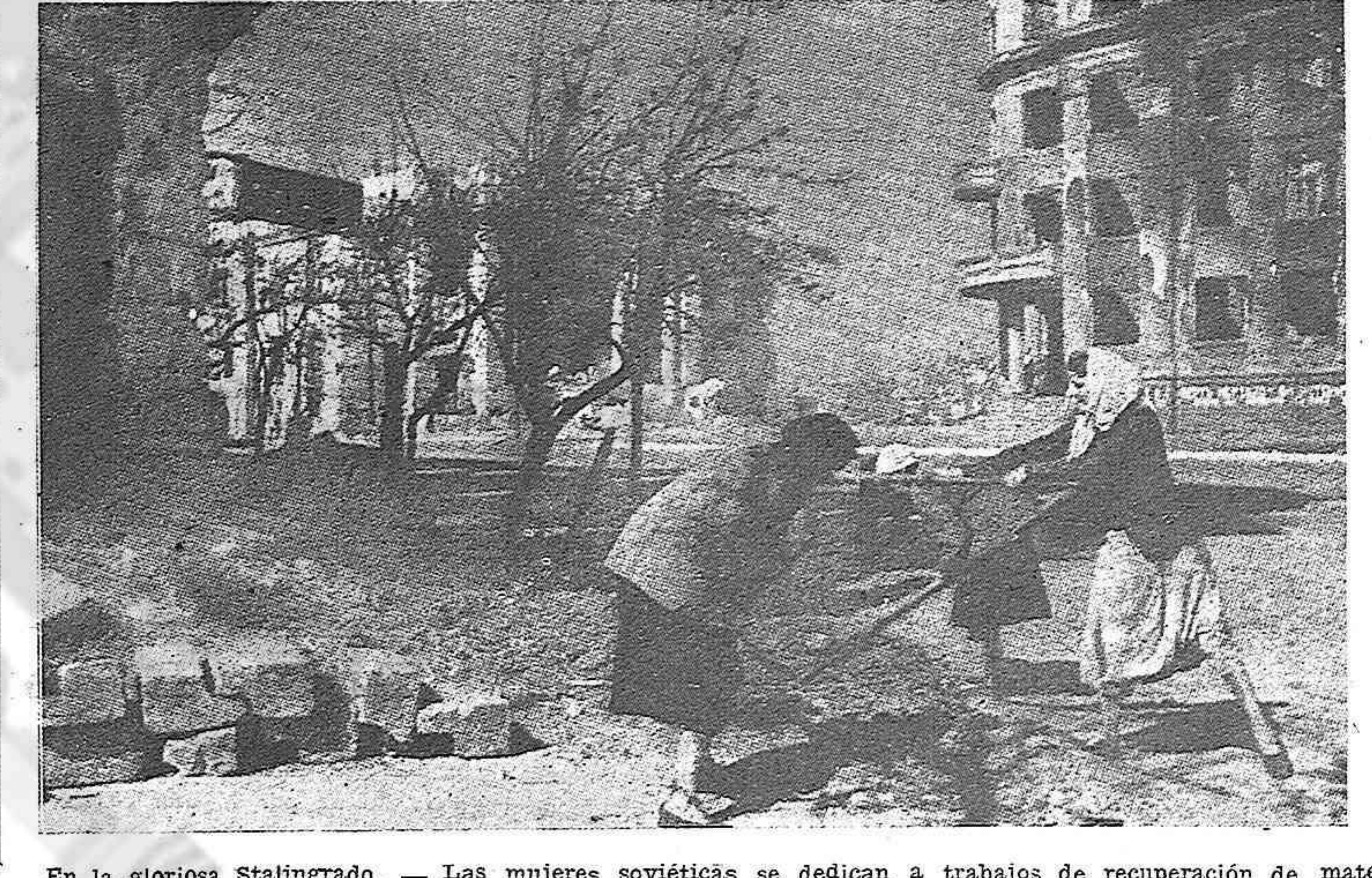
En la gloriosa Stalingrad. — Las mujeres soviéticas se dedican a trabajos de recuperación de materiales.