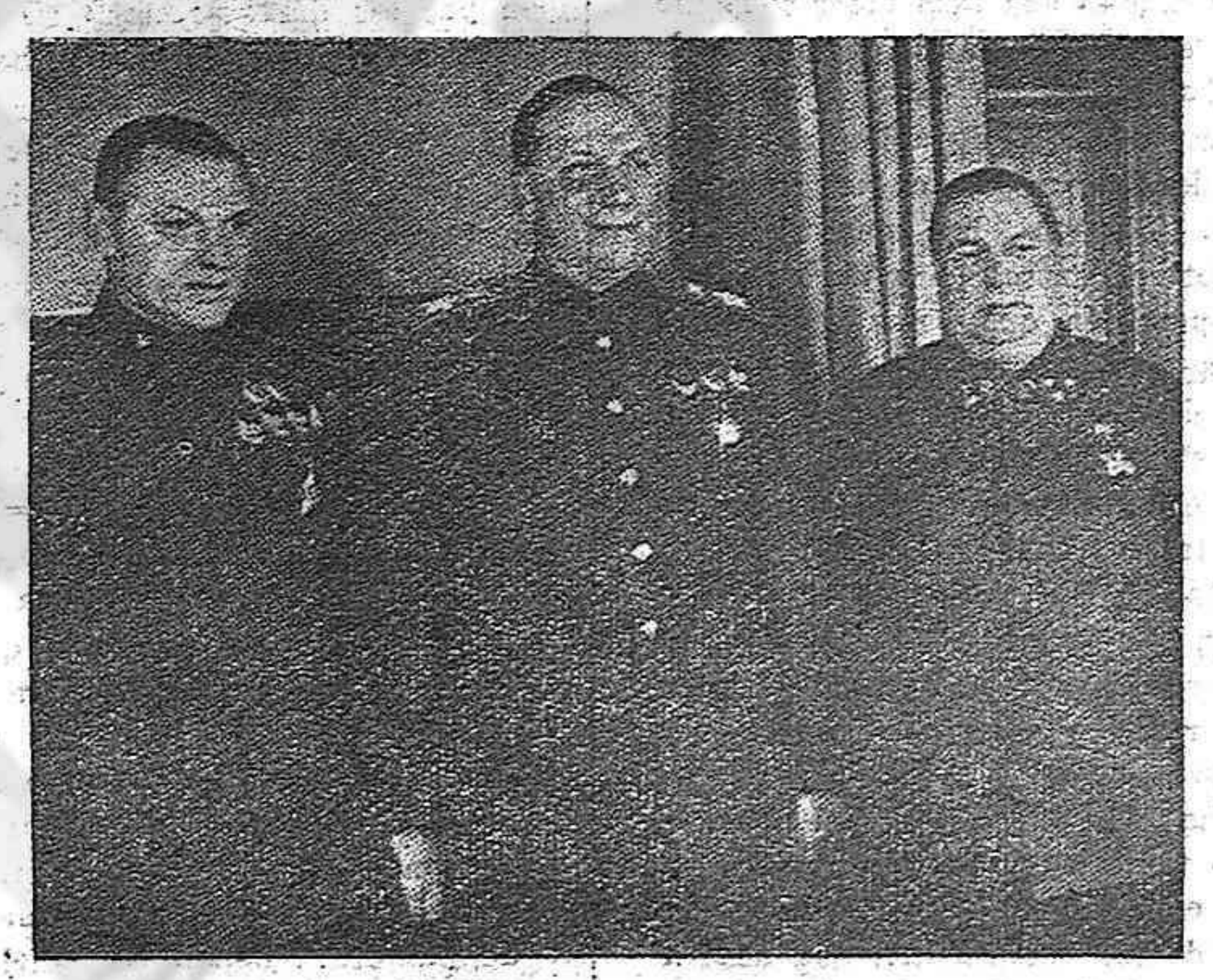
Tres grandes soviéticos.—De izquierda a derecha: ROKOSOVSKI, VON RONOV y GOLBUKHIN.

servas a los lugares más amenazados del frente. No puede decirse que la menor espectacularidad de los avances soviéticos se deba a un incremento considerable de la defensa alemana; lo cierto es que, una vez colocados los ejércitos en ofensiva sobre posiciones favorables, fundamentalmente a lo largo de la orilla oriental del Dnieper, tiene que aprovechar el tiempo en reparar