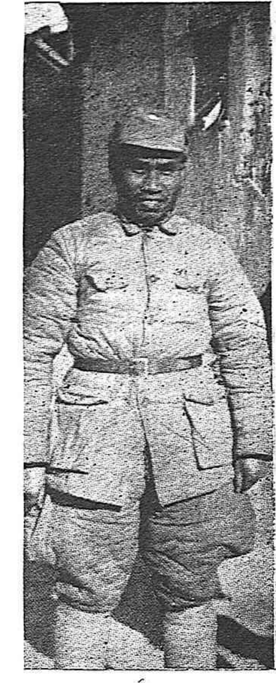
Chu Dé, dirigente del Partido Comunista de China, esforzando combates por la independencia y la libertad de su Patria invadida.

Después de sostener rudos combates con las fuerzas represivas franquistas, y cuando ya se les habían agotado las municiones, un pequeño destacamento de guerrilleros cayó en las garras de los sicarios falangistas. El Gobierno hitleriano de Franco, edificó a estos héroes, en la noticia en que da a conocer su captura, — como un "grupo de bandoleros".