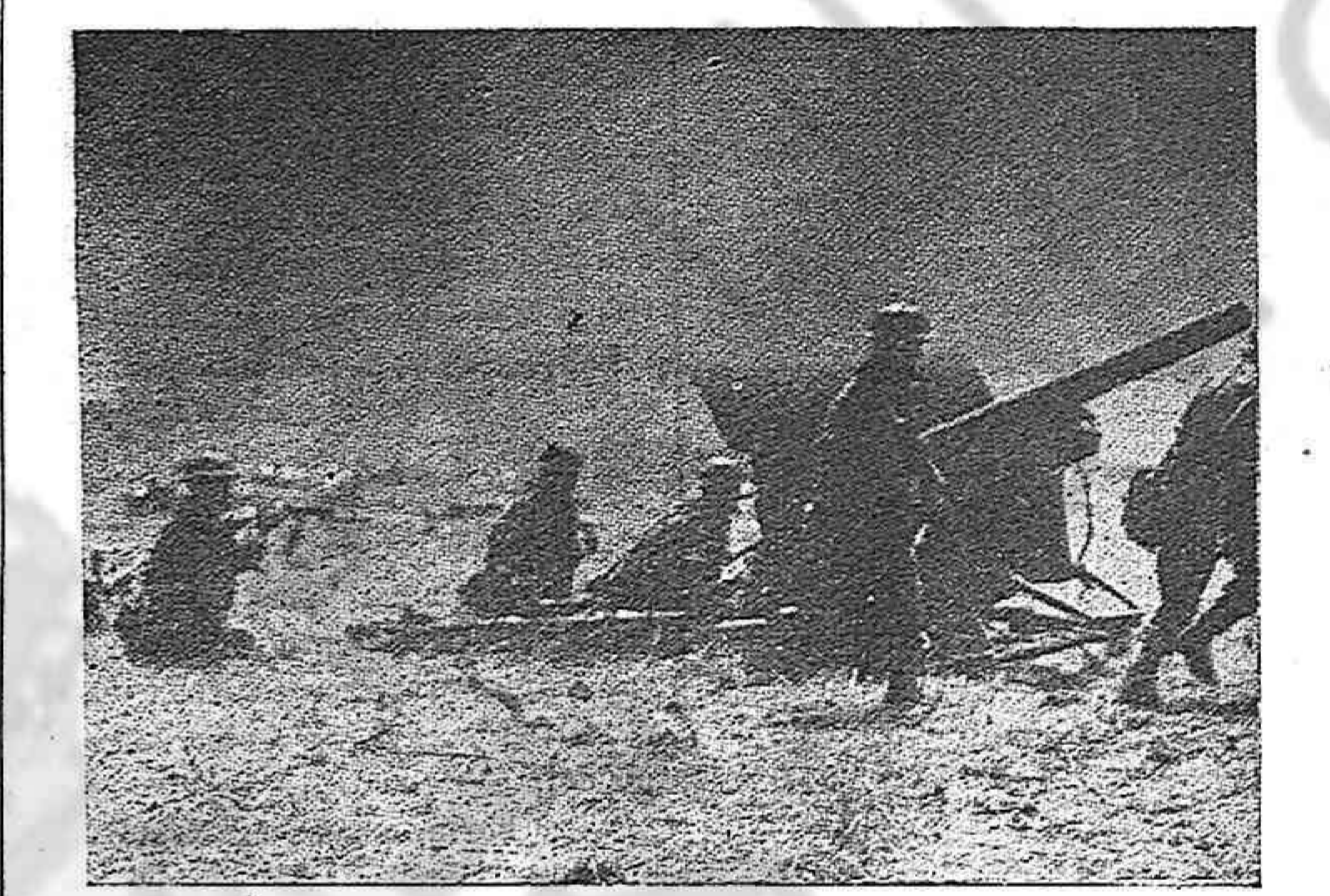
La artillería del Octavo Ejército británico abre en Italia el camino a la infantería en una de las operaciones de desembarco.

Los más modestos ahorros de los campesinos procuran por todos los medios que sean en esa moneda republicana, porque están seguros de que pronto adquirirá la plenitud de su valor y caerá de manera vertical la peseta de Franco. Naturalmente que también hay un factor de simpatía unánime del pueblo hacia la expresión monetaria de un régimen que les permitía vivir con libertad, con dignidad y libres de la obsesante pesadilla del terror y del hambre.