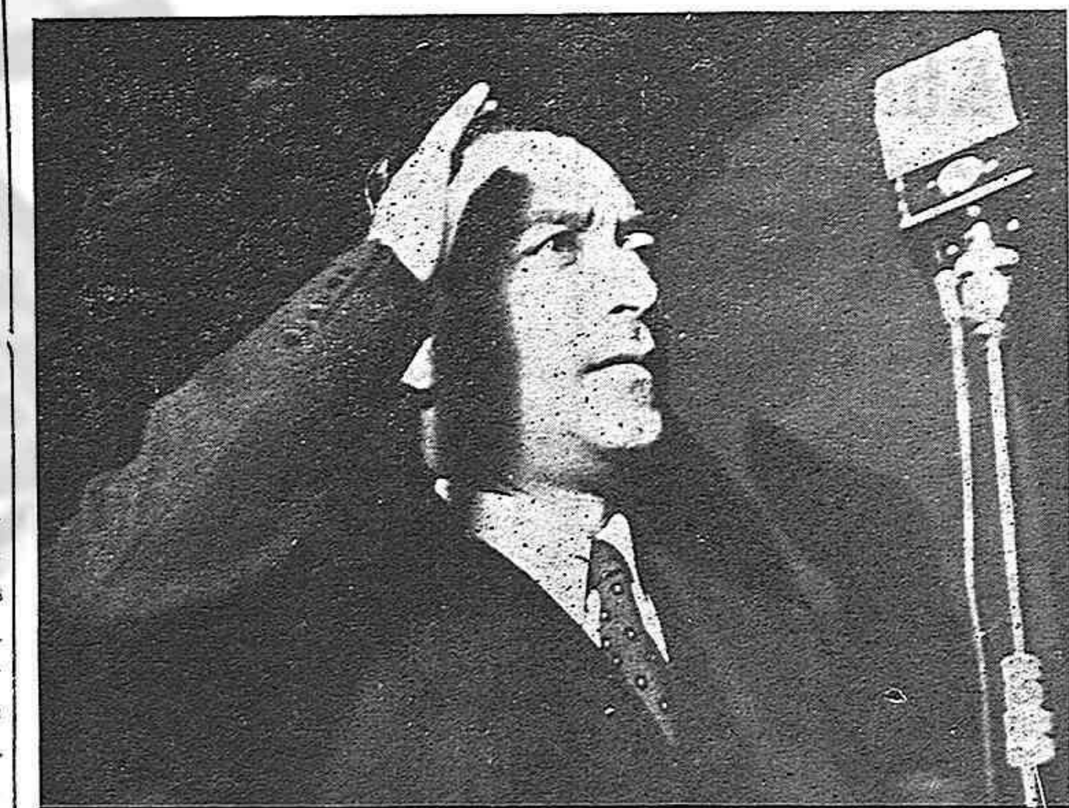
Lombardo Toledano durante su discurso en el mitin inaugural de la Convención de Solidaridad.

Contra Franco y la monarquía Comprenden tal vez que la continuación del régimen fascista sería excesivamente, y se piensa, como la línea que van a seguir los acontecimientos, en una restauración monárquica para España, (silbidos). Y yo pregunto, a la faz de todo el Continente americano, que llamaba Martí el Continente de la esperanza humana, y yo les pregunto a los que llaman Witman, el gran poeta de América, el hombre nuevo, yo pregunto: ¿Es que se va a fundar el orden nuevo en España a base de restauraciones y dominios de Borbones y Saboyas? ¿Es que el futuro Congreso de la Paz va a ser una especie de Congreso de Viena, y al menos para los pueblos que