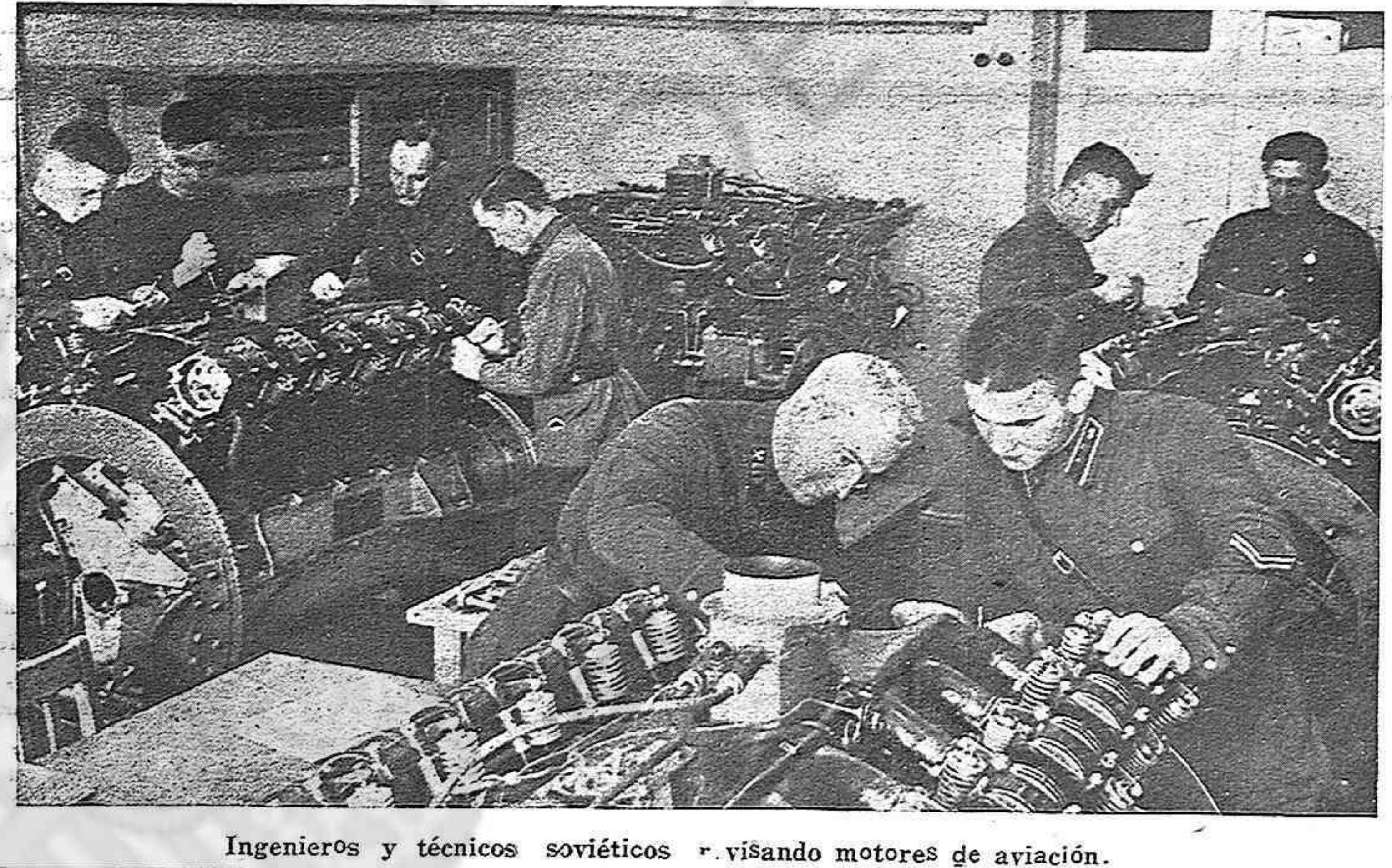
Ingenieros y técnicos soviéticos revisando motores de aviación.

Respecto a la situación interior en Italia, cayó la potente barrera que impedía la participación de las masas italianas en la lucha. El fascismo aún no está aniquilado. Intenta aún mantener el poder, pero el hielo se rompió. La caída de Mussolini permite a los aliados concentrar los golpes contra la Alemania hitleriana, enemigo principal de los pueblos libres. La banarrota del fascismo italiano subraya la posibilidad de la realización rápida del aniquilamiento de la tiranía hitleriana.