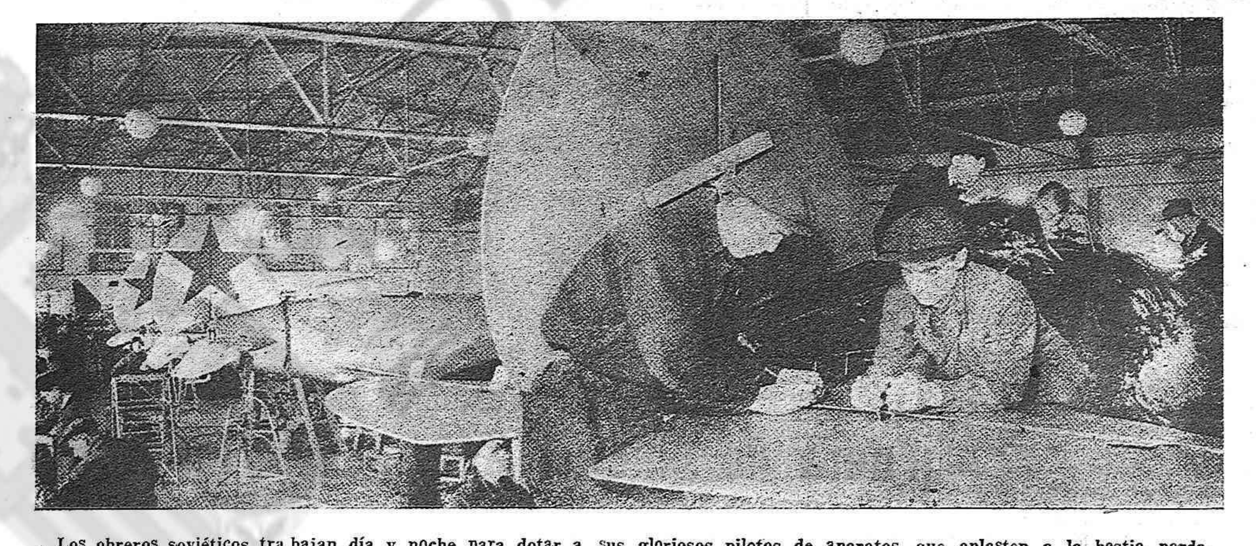
Los obreros soviéticos trabajan día y noche para dotar a sus gloriosos pilotos de aparatos que aplasten a la bestia parda.

leza a través de su propia emoción. En sus cuadros —como buen levantino— la luz adquiere corporeidad, como un personaje esencial, que con mano ágil fuera descubriendo el misterio de las cosas y su íntima belleza. El triunfo indiscutible de Estellés, que ya trajo a América una fama artística auténtica y noblemente ganada, nos enorgullece y la celebramos como un triunfo propio.