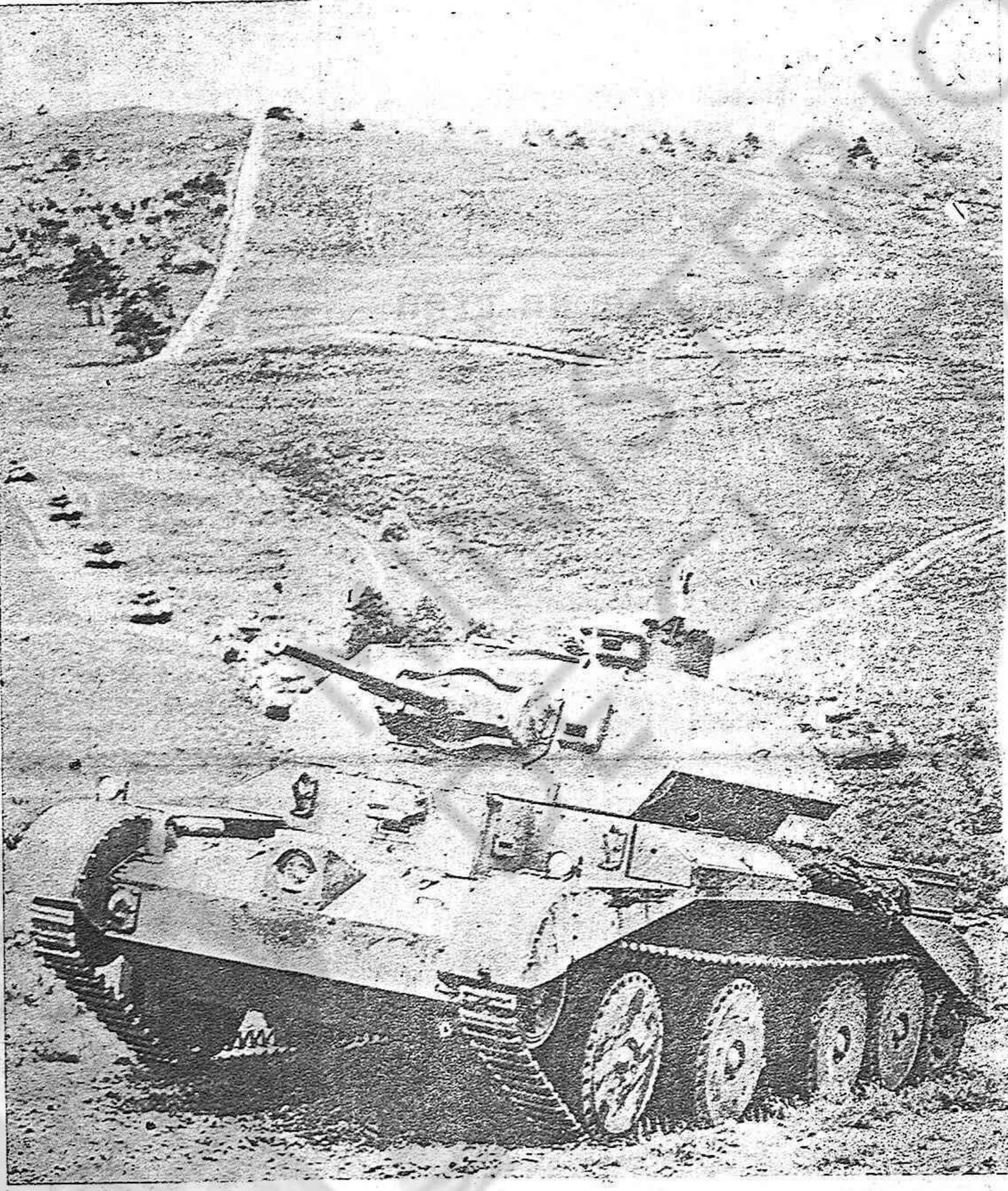
Una columna de tanques avanzando en la batalla por la toma de Túnez.

Es el espíritu de unidad patriótica, el deseo de vivir una vida democrática de libertad e independencia lo que hace que el pueblo de La Coruña, como todos los pueblos de España, quiera una Patria libre, independiente y democrática, sin Franco y la Falange, sin invasores.